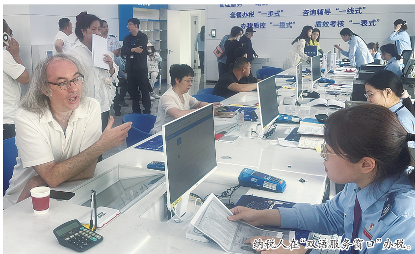
纳税人在“双语服务窗口”办税。

据介绍,该局还邀请新质生产力企业纳税人代表按照办税服务厅日常办税路线分别参观各功能区域,零距离体验