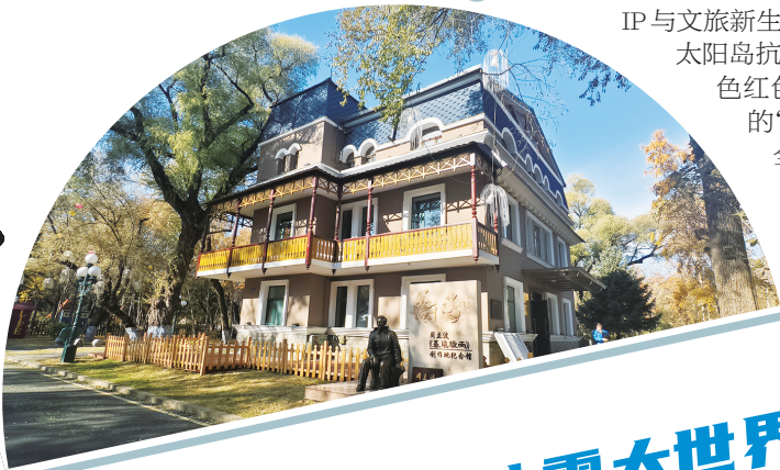
周立波创作地纪念馆。

周立波《暴风骤雨》创作地纪念馆，紧扣“一个时代、一本书、一个人”的主题，通过丰富馆藏、场景复原和互动体验，系统呈现土地改革历史与周立波创作历程，以“文旅+”思维激活文化资产价值，打造更多融合创新项目；通过文学经典活化与红色资源整合的创新实践，推动“文化+生态+旅游”多元发展，实现红色文化IP与文旅新生态的深度融合。目前，纪念馆已与太阳岛抗联纪念馆等点位串联，形成一条特色红色研学线路，打造出多元文化融合的“红色教育实境课堂”，为游客带来全新的红色文化体验。