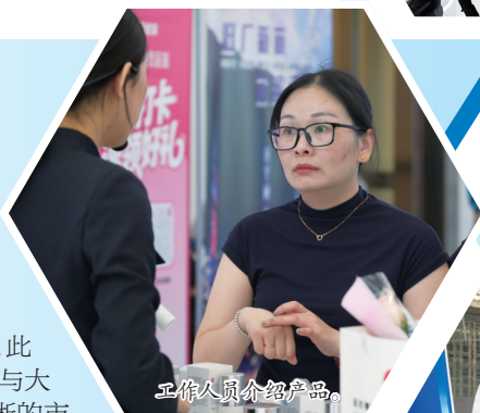
工作人员介绍产品。

采访中记者了解到，哈药生物深耕生物科研领域三十余载，当医美及大健康行业同质化竞争日趋激烈，哈药生物依托原料严格溯源、坚守医疗器械级生产标准两大核心优势，在市场竞争中站稳脚跟。