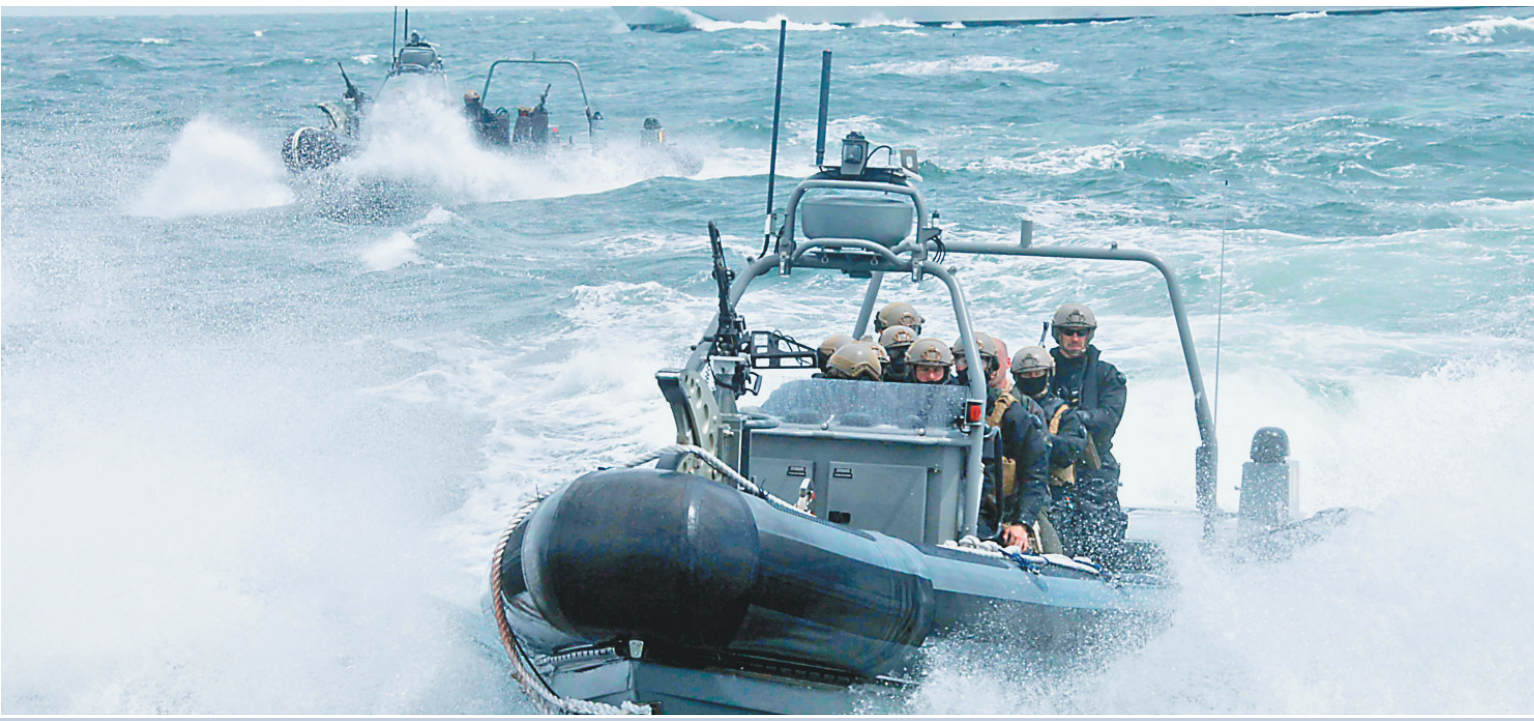
比利时军队实弹演习 6月17日,比利时士兵进行海上演习。当天,比利时陆海空三军在大西洋北海海域举行联合实弹演习。

知单”并拍照为证,事后司机要缴纳相应罚款。各城市对乱停车行为罚款数额也各不相同。目前,北京对乱停车每次处罚200元;沈阳每次处罚大多为100元;深圳则视情况处罚200元至2000元不等。 贴条罚款,被一些网友戏称是一个“无本万利”的生意。但仅靠罚款能否管住乱停车值得商榷。有专家指出,停车是刚性需求,光靠贴条罚款,无法根治违章停车现象。 不久前,北京市民王女士在百万庄大街路边