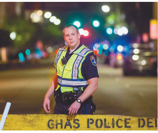
袭击黑人教堂 美一白人枪杀9名黑人

3 “驱走”懒政,创新执法根治“停车乱” 与停车乱象的背后,既有百姓的诸多无助,也有相关执法者的无奈。 记者在北京多个小区周边发现,一些居民专门在驾驶室前窗贴上标语:“尊敬的协管员同志,请高抬贵手。”一些交通协管员也表示,有时心里也很别扭,不能让百姓为市政规划的不合理而买单。“有的小区规划的停车位真是不够,总不能天天‘贴条’让市民交罚款啊!” 所谓“贴条”罚款,就是在交通协管员发现违章停车后,在车上张贴一张“违法停车处置通