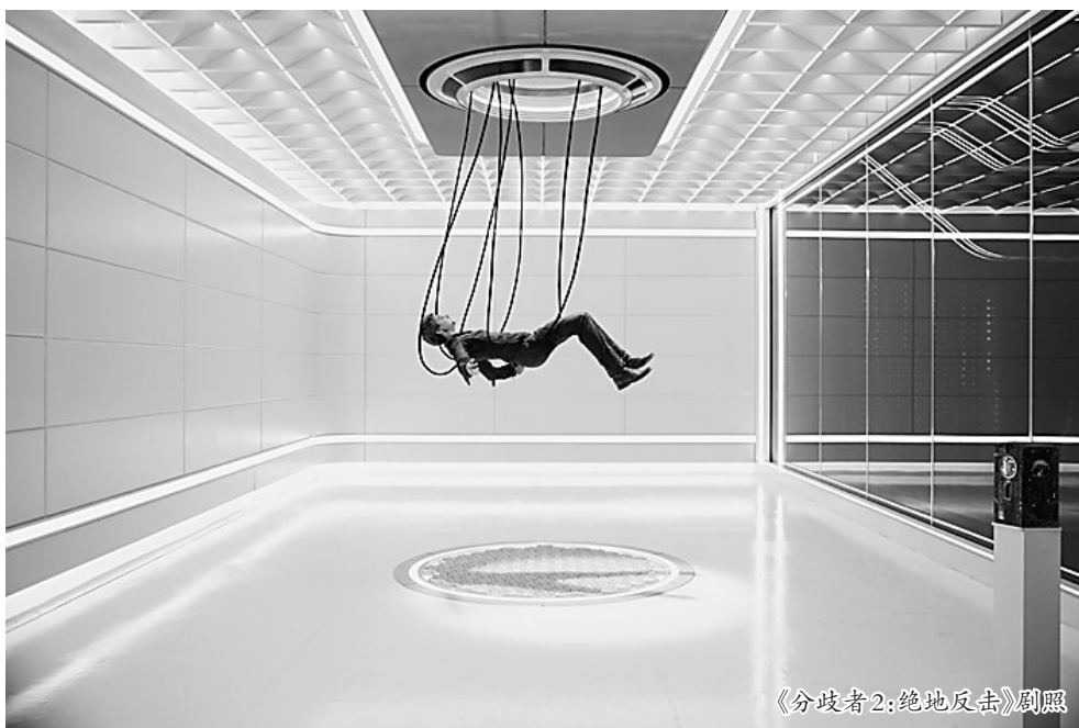
《分歧者2:绝地反击》剧照

系列第二部电影,《分歧者2》全面升级,从其中的三大看点就可以显示影片的精彩之处。