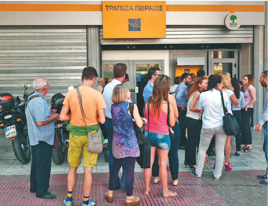
6月29日,在希腊雅典,人们在关闭的比雷埃夫斯银行外的自动取款机前排队取钱。 新华社发

目前,希腊与布鲁塞尔的主要分歧是,希腊一直拒绝按布鲁塞尔要求削减养老金和国防预算,希望在本商品与旅游服务方面维持较低增值税率,更希望债权人进行新一轮债务减计,希望从“容克计划”中获取更多资金。而以德国财长朔伊布勒为代表的强硬派则强调“纪律”,认为如果债权人太过仁慈,希腊就会赢得“赌局”,往后其他欧元区成员国就会效仿。