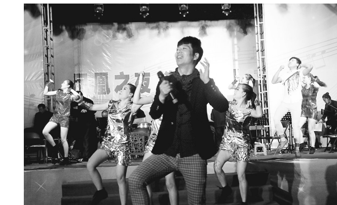
日前,在中国·龙江凤凰山第六届杜鹃花节期间,来自尚志市“雪都艺术团”的30多名演员与景区舞蹈队联袂,专场演出了“凤凰之夜音乐会”。他们表演了器乐演奏、京剧联唱等17个节目,为景区游客和林区群众送上精美的文化艺术大餐。

狠抓落实是关键。做好对“三严三实”专题教育活动的落实工作,确保此项活动有的放矢,扎实有效。