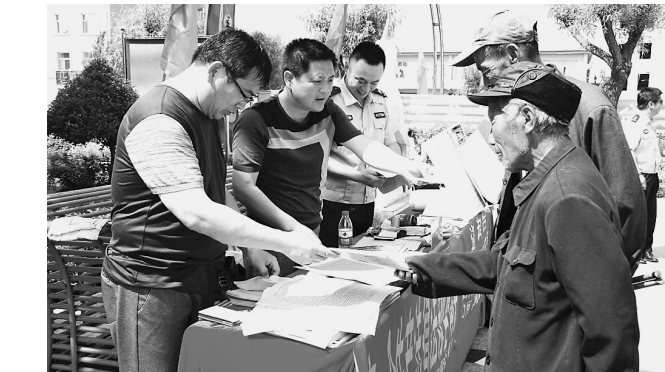
日前,东方红林业局举行了以“加强安全法治、保障安全生产”为主题的安全生产月宣传活动,增强林区群众的安全意识。

2015年10月末,国宝大熊猫馆安家亚布力度假区,成为龙江“一枝独秀”。依托亚布力丰富动植物资源,开发建设兼顾物种保护、科普教育、科学研究、休闲娱乐等多功能于一体的森林动物园(熊猫馆),引进大熊猫、东北虎、紫貂、梅花鹿、棕熊、黑熊等20余种动物,彰显东北大森林无与伦比的生态魅力。