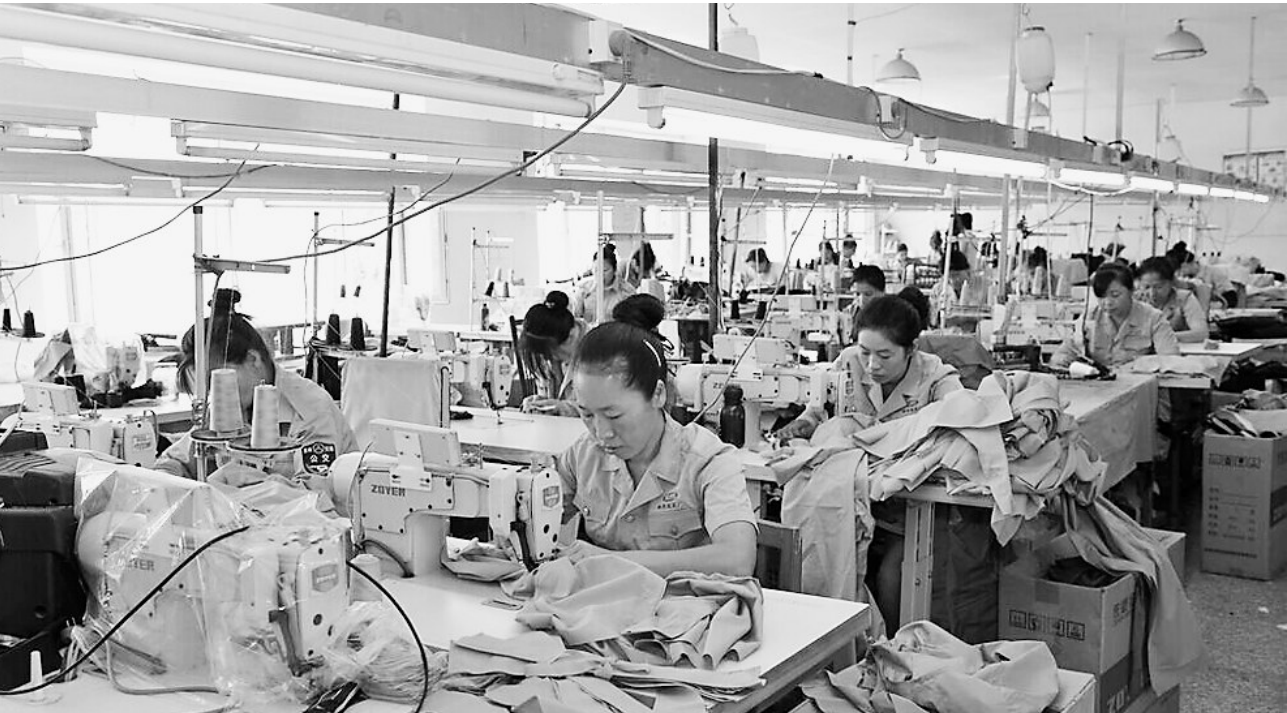
绥棱林业局提供多项优惠政策,安置当地职工就业。

备、采伐设备,发展仓储物流业,分流安置富余职工。实施“走出去”战略。广泛联系大型用工企业,通过实地考察,制定扶持政策,向林区外、省外、境外输出劳务,重点向经济发达地区输送林区富余职工和离校未就业的高校毕业生就业。积极创造条件,把林区成功的采伐、运输、贮木经验送出国门,解决富余职工转岗安置问题;推进全民创业。积极开展大众创业、万众创新活动,以创业带动就业。积极支持森工重点产业园区创业孵化基地建设,加强创业培训,在就业创业政策和资金上予以支持,积极分流安置富余职工;适度开发公益性岗位。总局有计划地指导各林区开发公益性岗位,安置大龄就业困难人员在林区保洁保绿保安、养老服务公益性岗位就业,减轻林区就业压力,实现大龄就业困难人员的托底安置;各企业可根据实际情况,因地制宜,制定扶持就业的优惠政策,给予工资补贴、岗位补贴和社保补贴,鼓励林区个体、私营等非公企业吸纳林区下岗职工实现再就业;取消林区外委用工,为安置分流富余职工腾出岗位。对天保工程中的森林抚育、管护及林区基础设施建设等工程项目,经过对下岗职工免费的定向、专业的技能培训,一律使用林区国有企业职工,优先安置下岗职工转岗就业。