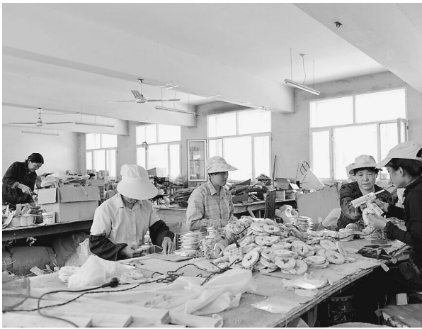
绥棱林业局草柳编培训中心,为林区妇女提供培训和就业平台。