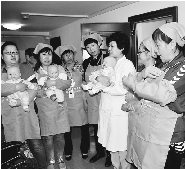
省森工总局与哈尔滨市选择月子中心合作举办劳动技能培训班,林区职工在这里找到了新的就业方向。

就业是民生之本。稳定的就业,是一个家庭基本生活的保障,更是一个地区长治久安、稳定和谐的基础。全面转型中的龙江森工林区,在寻找企业转型发展新路径的同时,坚持以民生为考量,积极引导职工转岗、再就业,带领群众自主创业,使林区的幸福之花有“根”可依。