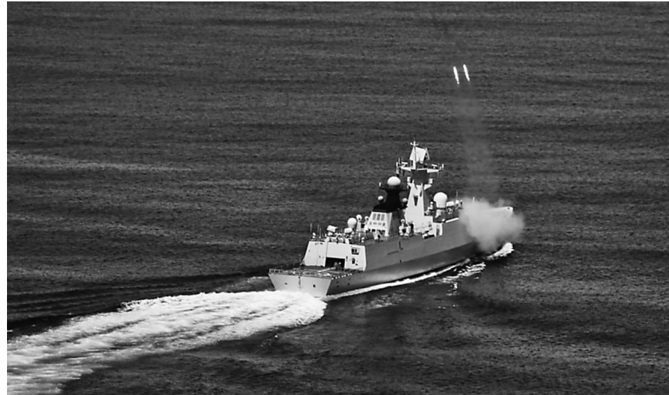
7月22日,中国海军导弹护卫舰常州舰在训练中发射火箭深弹。当日,由导弹驱逐舰长春舰、导弹护卫舰常州舰、综合补给舰巢湖舰组成的远海训练编队在西太平洋海域进行主炮、副炮和火箭深弹等武器射击训练。该编队是18日穿越宫古海峡进入西太平洋开展远海训练的。