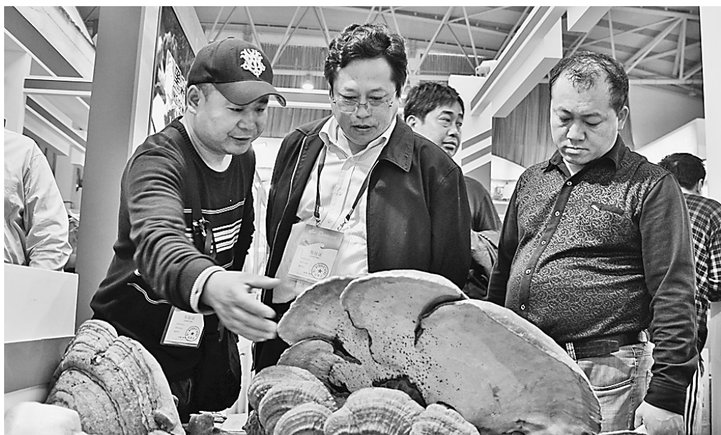
青岛旗舰店内硕大的灵芝工艺品引人注目。