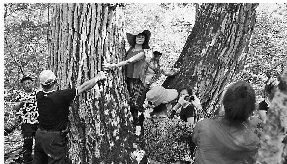
近年来,生态旅游在通北林区火热起来,人们成群结队来到林区,呼吸新鲜的空气,感受大森林原始自然的美丽。