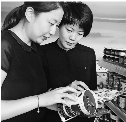
顾客在黑森北京旗舰店开心选购。

这次签约与以往不同,“黑森”绿色食品(集团)有限公司加盟中国森林食品网,采取了“入股营销、借势营销、互联网营销”的方式进行战略合作。这既可发挥龙江森工绿色食品产地生态优良、产品天然绿色的优势,又可发挥中国森林食品网在产品推广、品牌传播的互联网营销优势,是龙江森工绿色食品在开启全速发展时代后,“黑森”绿色食品推进互联网+行动,实现旗舰店、连锁店、超市线下销售和电商线上销售有机结合的一次全新探索。