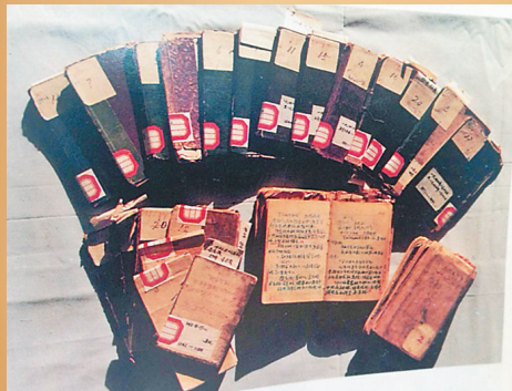
周保中抗日游击日记。图片出自画册《周保中将军和他的抗联战友》。本报记者 董新英翻拍

在黑龙江这片土地上,周保中战斗的足迹遍布依兰、牡丹江、宁安、林口等地,东北抗联十四年艰苦卓绝的历史,周保中见证了十四年,亲历了十四年,他在生命的最后一刻依然回忆着记录着这段历史。他与东北,情深意重。周保中,戎马半生,在东北坚持抗战14年,鞠躬尽瘁为人民,用生命写下了可歌可泣的诗篇,龙江人永远不会忘记他。