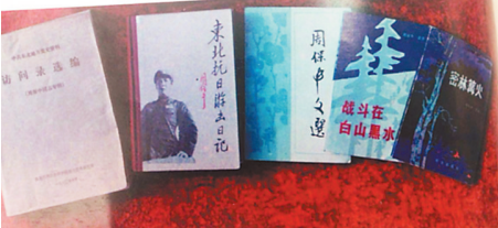
周保中生前对东北抗日联军史的研究工作贡献巨大,图为编辑成书的部分文献。图片出自画册《周保中将军和他的抗联战友》。本报记者 董新英翻拍

日伪不止一次重金悬赏缉拿周保中,早在周保中在王德林救国军担任前线总指挥部参谋长时,因其指挥部对日寇进行过多次威震敌胆的战斗,如攻克东京城、安图县城、破坏吉(林)会(宁)铁路、攻下敦化县城、再次攻打宁安等著名战斗,周保中的名号使敌人闻风丧胆,日伪为此特别贴出缉拿周保中的重金悬赏布告。