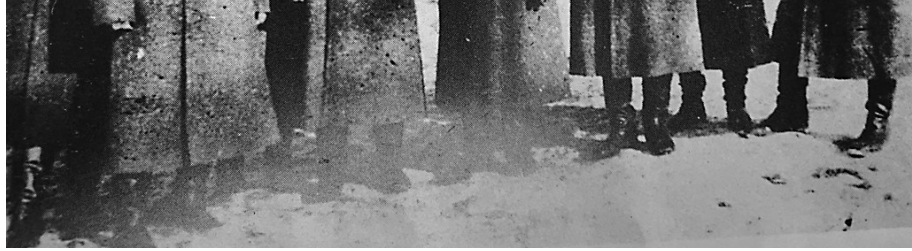
上图为周保中(左四)、张寿琨(右三)与苏联远东红军军官的合影。右图为1949年4月下旬,周保中、王一帆与女儿周伟于北平颐和园。图片出自画册《周保中将军和他的抗联战友》。本报记者 董新英翻拍

由于敌我力量悬殊,西征失败,数万日伪军设立重重封锁线,周保中及二路军总部人员被困在下江山林之中。周保中与战士们克服饥饿、寒冷、伤病、缺乏武器弹药、战斗伤亡等种种困难,坚持与敌人进行战斗。战士们只能在深山中挖地窖隐蔽。一连十多天,粮食吃光了,扒树皮、挖雪里的野草充饥。没有水喝,吃雪。数九隆冬,地窖里奇冷异常,周保中领头相互撞击身体增加热量。后来,饥饿使他和战士们倒卧不起。但他凭着微弱的体力,断断续续地讲笑话鼓舞大家。他们在听得见头上敌人踩雪声响、飞机轰鸣,被饥饿和寒冷折磨得死去活来的异常艰苦情况下,以超常