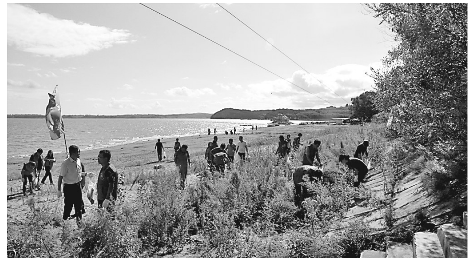
日前,宾县党员志愿者、巾帼志愿者、青年志愿者服务队和二龙山风景区发起“环湖环保”志愿服务活动,200多名志愿者分赴龙珠雪场南端东山码头、南端湖边、二龙壁附近湖边等环湖区域开展了环湖清洁活动,共同保护母亲湖。