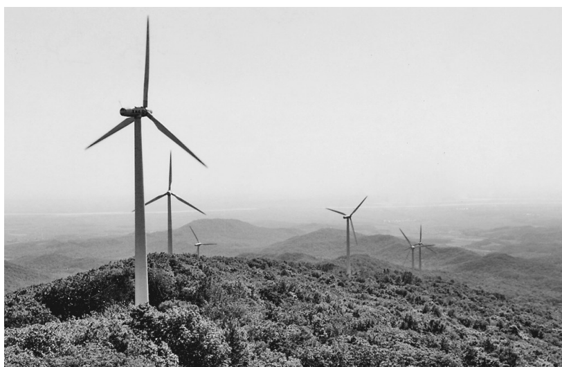
木兰县蒙古山风电场。

在景区开发建设上,鸡冠山景区自2012年9月由兴隆林业局实施建设,已累计投资5000万元,包括路面硬化、登山栈道、游步道及观景台等设施。在主山门和旅游综合服务区选址问题上,决定在建国乡三门徐屯建设旅游综合服务区,“局县共建”取得了新跨越。目前,从三门徐屯至沙河林场的25公里进山