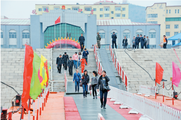
抚远口岸旅客出境。

围绕俄罗斯需求,大力发展果蔬种植。在通江乡建设了对俄蔬菜示范基地,项目总投资2300万元,占地82亩,建设高寒节能温室19栋,已完成投资1000万元,年底建成投产,该项目对带动全县发展对俄无公害、绿色、有机果蔬种植出口具有极大示范引领作用。与天海润集团上海铂天生物科技有限公司合作开展蔓越莓种植和深加工,项目一期投资3亿元,种植面积5000亩,现在正在进行土地平整、基础设施建设,已完成投资6000万元;二期计划投资30亿元,种植面积50000亩,通过蔓越莓规模化生产和深加工带动特色农业发展。