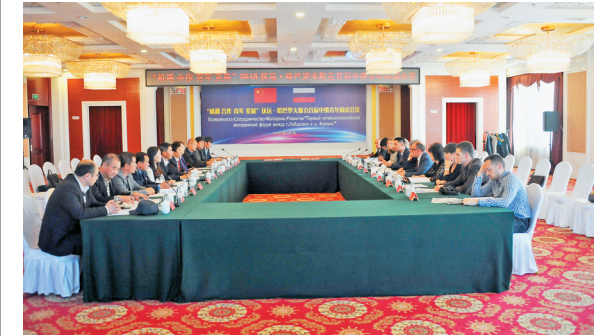
中俄青年交流会议现场。

据了解,2015年是中俄两国政府确立的“中俄青年友好交流年”,这是中俄两国互办“国家年”“语言年”“旅游年”之后的又一大型中俄交流项目,抚远与哈巴罗夫斯克一衣带水、隔江相望,在长期的发展中建立了密切的关系和深厚情谊。为了使双方青年积极交流,增进了解,加深友谊,抚远县和俄哈巴市共同举办了第二届“世代友好 共圆梦想”中俄青年友好交流活动,两地互派青年到对方城市进行了友好访问和交流互动,旨在搭建广阔平台,促进抚远和哈巴两地青年在跨境电商、旅游服务、互市贸易等领域进行友好交流,务实合作,互利共赢。两地还以“抚远青年眼中的哈巴”和“哈巴青年眼中的抚远”为主题,互派青年摄影爱好者拍摄了大量反映两地风土人情和经济社会发展的图片,这些图片分别在两地举办了“携手青春 镜观双城”首届中俄青年摄影展。