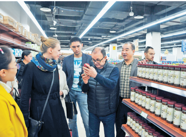
抚远边民互市贸易中心。