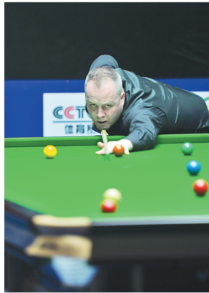
苏格兰选手希金斯摘得冠军。