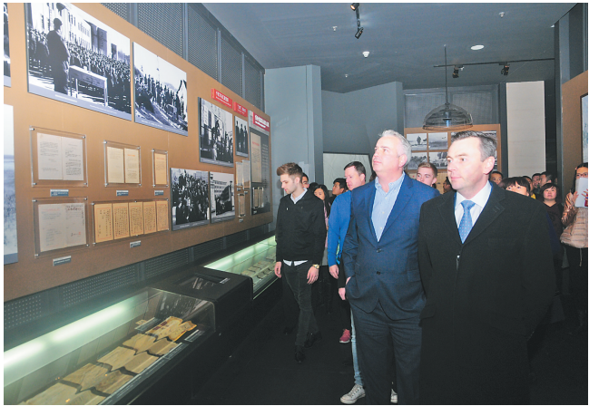
世界职业台球协会主席杰森·弗格森(右一)和斯诺克球星参观铁人王进喜纪念馆。