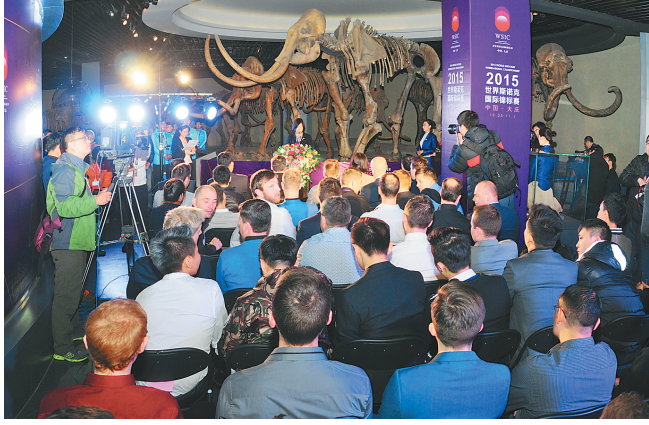
大庆博物馆斯诺克国锦赛新闻发布会现场。

这是大庆这座年轻城市的一个盛大节日,这是体育赛事与城市的一次成功联姻,堪称我省城市宣传推介和潜能释放的成功范例。