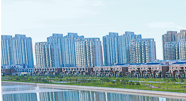
宜居宜业美丽大庆。