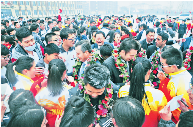
斯诺克球星走进大庆四中。