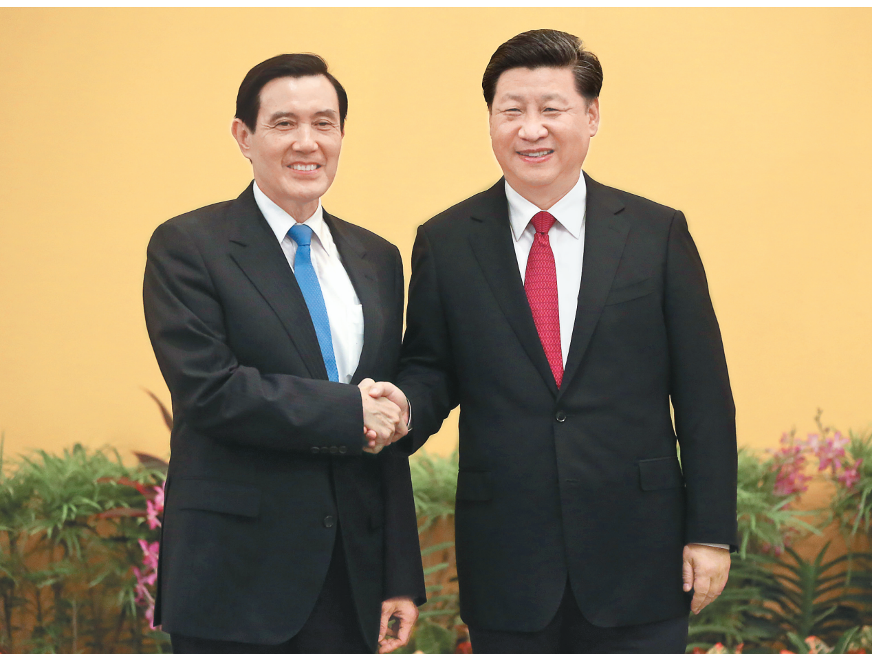
11月7日,两岸领导人会面在新加坡香格里拉大酒店举行。这是习近平同马英九握手。

两岸双方应该坚持“九二共识”、巩固共同政治基础,坚定走和平发展道路,深化两岸交流合作,增进两岸同胞福祉,共谋中华民族伟大复兴。