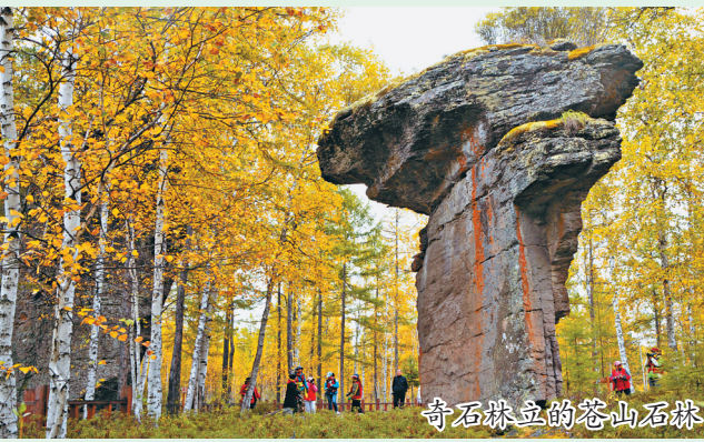
奇石林立的苍山石林