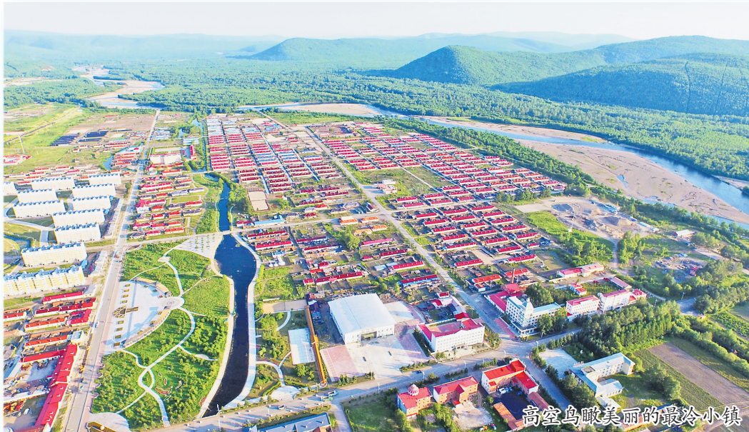
高空鸟瞰美丽的最冷小镇

次。召开座谈会30多次,走访群众150余人,征求群众意见80余条。全区546名在职机关党员和26个区直单位进驻社区认领了服务岗位,成立志愿者服务队24支,志愿者4500余人,开展政策宣传300人次,打扫卫生、维修电器等义务献工1000多次,捐赠衣物2000多件,资助贫困学生150多名,资助资金10万余元。