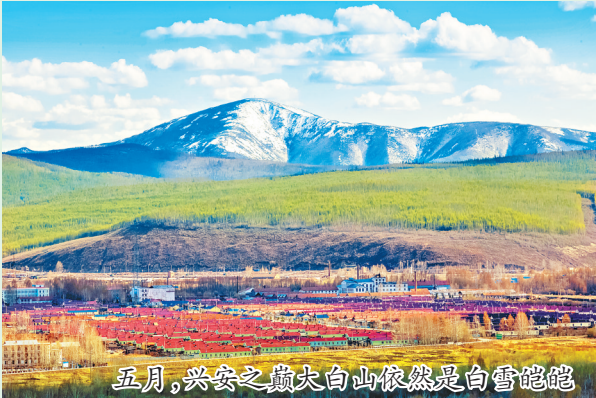
五月,兴安之嶺大白山依然是白雪皑皑