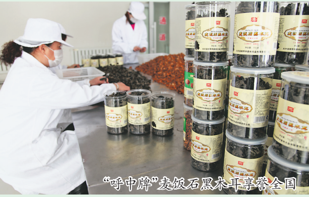
“呼中牌”麦饭石黑木耳享誉全国