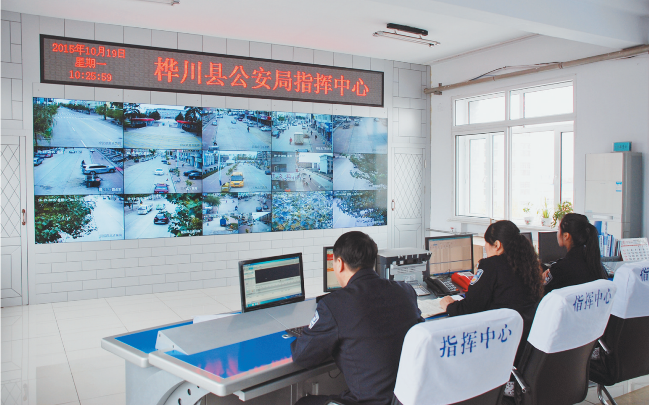
平安城市视频监控工程。

系统建设和应用的重要性,2014年,开始立项研究建设工作,在财政状况十分不好的情况下,投入资金400余万元,由公安局牵头,于2015年初开工建设。为了节省开支,桦川县公安局抽调专门力量,自己设计方案,研究点位布局,亲自组织施工,到11月中旬,全县一线视频监控平台和派出所二级平台建设全部完成并投入使用。为打造桦川公安局的“科技支撑品牌”奠定了良好基础。