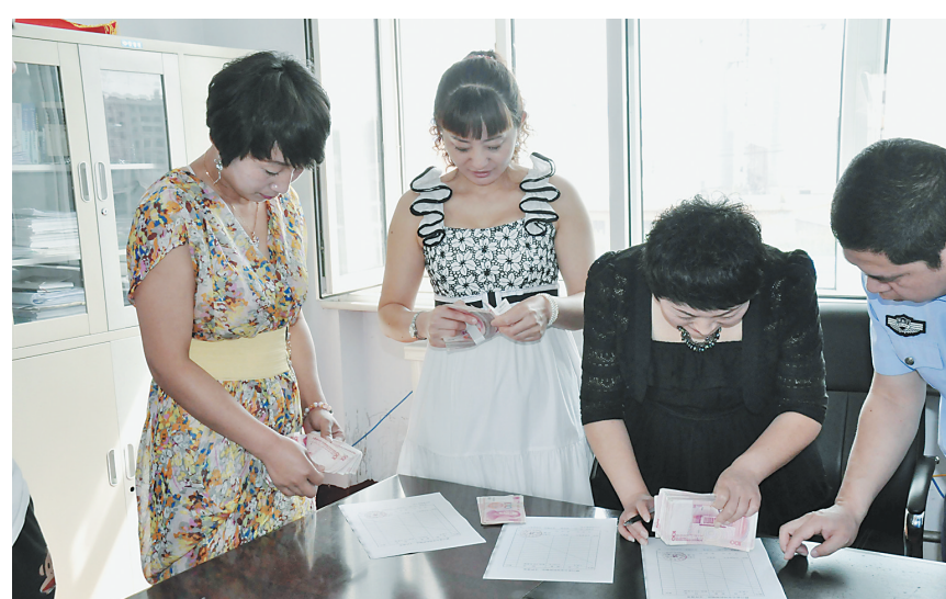
百姓拿回被盜被抢物品。

扶贫助弱实现日常化,确保及时帮助群众排忧解难。桦川县公安局注意把帮助群众做好事、解难事融入日常工作,户政部门实行上门服务,为行走不便的群众办理身份证件,巡逻民警注意在日常街面巡逻中帮助群众解决问题,派出所民警在工作中,始终注意发现群众困难,积极解决困难。2015年1月份以来,桦川县局累计为群众捐款、捐物总价值三万余元,县局交警大队在秋收之际,出资一万余元,为桦川县悦胜村修缮田间路五百余米,解决了群众秋收难题。