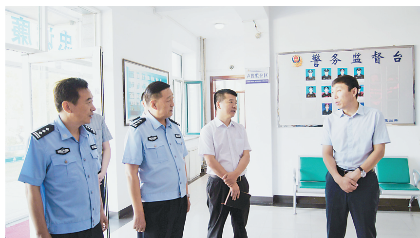
县委书记郭广福到桦川公安局调研。

仅2015年,桦川县局就通过情报信息研判破获系列案件3串60余起盗窃案件。2015年8月,桦川县辖区发生一起交通肇事逃逸案,交警部门久侦未破,提请情报信息中心协助侦查,情报信息中心仅用一个小时就获取重要线索,交警部门根据线索在同江市将犯罪嫌疑人抓获。