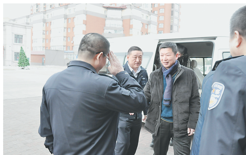
姜宇峰县长慰问公安民警。