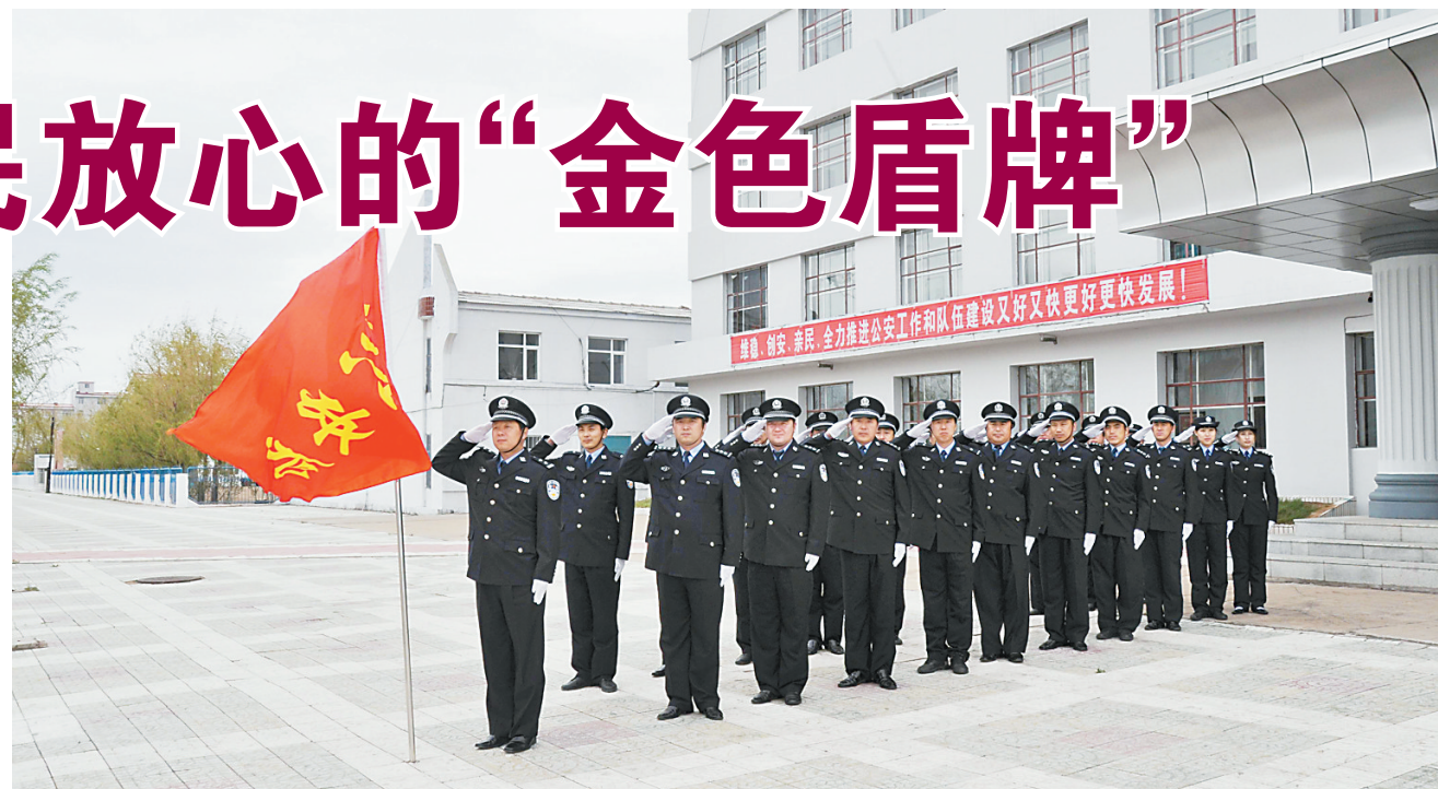
桦川公安民警警姿训练。

从辖区面积、人口到警力数量,桦川县公安局在佳木斯市所属5个县(市)公安局中是最小的。小局,照样遭遇了发展中的瓶颈和短板:科技水平落后,警力不足、人员老化。就是这样一个小局,通过科技强警,筑坚固本强警,在快发展、大发展中拥有了大作为。科技水平提高了,警力充实了,警员精气神足了,发展实现了加速度,公安工作赢得党和人民的满意。