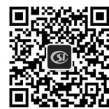
哈尔滨市医保中心公共微信