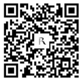
哈尔滨市人才服务局公共微信