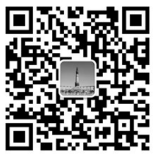
哈尔滨市人社局公共微信