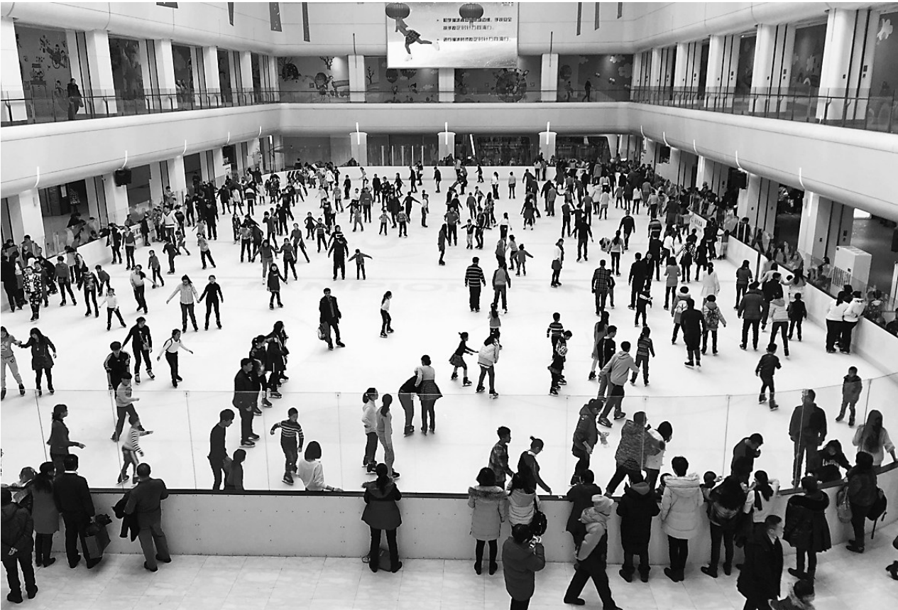
春节期间,哈尔滨市某商场内的滑冰场吸引了大量的滑冰爱好者,市民穿着单薄的衣服驰骋在冰场上别有一番情趣。

雪乡作为美丽中国十佳旅游景区之一,备受游客喜爱。春节期间,中央电视台“一年又一年”栏目组赶赴雪乡录制拍摄了《新年赶大集》和《雪乡过大年美食篇·初一夜饭》节目。越来越多的游客涌入景区,春节前三天共接待游客近 2.9 万人次,收入近 2850 万元。牡丹江市雪堡、镜泊湖、横道滑雪场等景区接待人数也大幅度提升。 除团队游外,还有家庭旅游、自驾旅游和自助旅游,其中自驾游逐渐成为黄金周旅游市场主流。春节前三天,牡丹江市共接待游客 11.41 万人次,收入 2916.63 万元。大庆