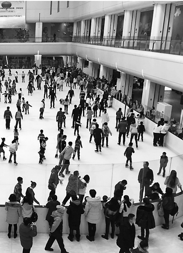
春节期间,哈尔滨市某商场内的滑冰场吸引了大量的滑冰爱好者,市民穿着单薄的衣服驰骋在冰场上别有一番情趣。