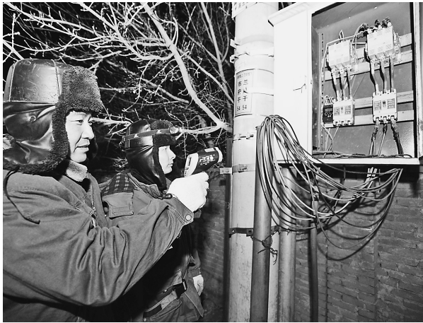
春节期间,国网黑龙江电力哈尔滨供电公司配电网巡视人员对线路及设备进行特殊巡视,确保负荷高峰期间电网运行平稳。

大学生奖励金入伍后六个月内发放完毕 我省规范义务兵和自主就业退役士兵优待补助金发放 大学生奖励金入伍后六个月内发放完毕 本报讯(王雨蓉 记者郭铭华)记者日前从省政府获悉,近日,我省出台《黑龙江省义务兵和自主就业退役士兵优待补助金发放实施办法》,进一步规范我省义务兵和自主就业退役士兵优待、补助金发放工作,并要求各项资金在规定时限内发放到位。 据了解,《办法》中的优待、补助金主要是指义务兵家庭优待金、进藏兵和高原条件兵高原生活补助金、入伍大学生奖励金、自主就业退役士兵一次性经济补助金。入伍大学生奖励金发放对象包括服役义务兵役的全日制高等教育院校新生、在校生和毕业生。优待、补助金实行社会化发放,每年兵役登记时,各级兵役机关应指导应征公民在新兵起运前 2 个月到当地人社部门采集基本信息,办理社保卡。人社部门应在信息采集成功后为其发放社保卡,作为资金发放的基本渠道。 《办法》规定,义务兵家庭优待金、进藏兵和高原条件兵高原生活补助金按年发放。第一年的在批准入伍后 12 个月内发放完毕,第二年的在服役义务兵役期满后 2 个月内发放完毕。大学生奖励金原则上在批准入伍后 6 个月内发放完毕。自主就业退役士兵一次性经济补助金原则上应当于自主就业退役士兵报到结束后 20 个工作日内发放完毕。 同时还提出,因国家有关政策规定的其他特殊原因推迟报到的退役士兵,各级政府及有关部门要区别对待,统筹安排,及时统计、测算,按规定程序发放自主就业退役士兵一次性经济补助金。此外,因入伍新兵名单遗漏的,由县级兵役机关按规定标准自行解决优待、补助金;因兵役机关提供名单不准确等原因造成错发的优待、补助金,由县级兵役机关负责全额追缴并归还原渠道;因不符合条件被部队退兵、被部队除名或开除军籍的,由县级兵役机关关于接收后 10 个工作日内通报同级民政部门,由民政部门按规定停止优待,因未及时通报造成资金错发的,由县级兵役机关负责全额追缴并归还原渠道。 此《办法》自 2015 年夏秋季征集的义务兵开始执行,2015 年以前入伍的义务兵按原规定执行。