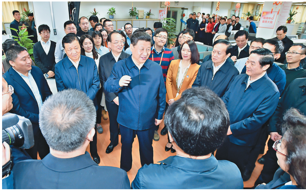
习近平在人民日报社总编室同编辑们亲切交流。