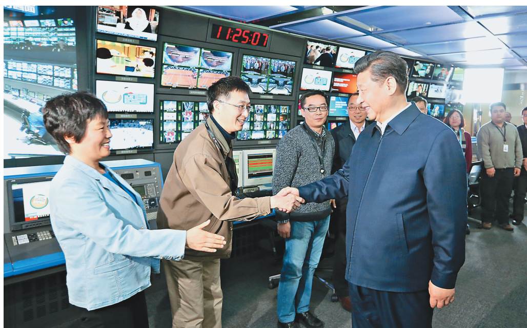
习近平在中央电视台总控中心同工作人员亲切握手。