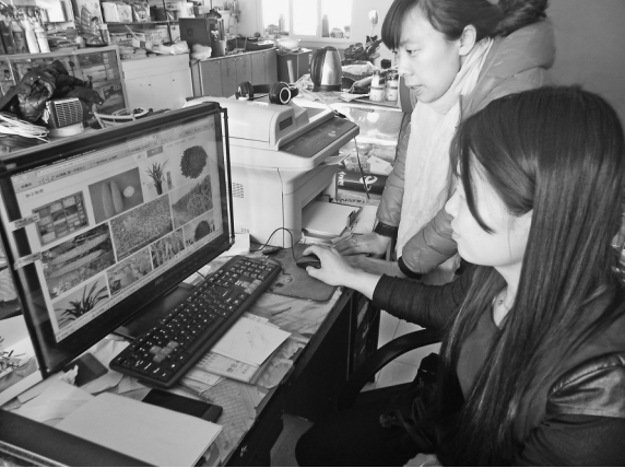
网上各卷耕成了农民选购农资的新途径,图为青冈县昌乐乡东村农民网上购买化肥等农资。

本报讯(马明超)海伦市充分挖掘富硒黑土优势,坚持市场引导、科学规划、合理布局,通过强化富硒品牌拉动,以降米、扩豆、增稻、上特色为原则,大力实施围城蔬菜开发带、沿路特色经济作物开发带、沿河草食禽禽开发带和100万亩富硒基地核心区“三带一区”发展战略,确保农副产品卖上好价钱。 土壤天然富硒是大自然赋予海伦的宝贵财富,2016年,该市将重点打造100万亩富硒产业核心区和150公顷富硒产业园区的“双百工程”。在“海伦大米”、“海伦大豆”两项国家地理标志认证完成及“海伦大豆”证明商标成功注册的基础上,把绿色、有机食品生产与富硒食品生产结合起来,打绿色富硒、有机富硒食品品牌;在开拓营销市场上,加快海伦物联网演示监管中心大数据云平台以及企业销售终端建设,构建完善的生产、加工、销售全程可追溯体系;开拓高端市场,在北、上、广等发达地区创建20家实体店,构建辐射全国的综合立体营销网络布局。 重点扶持草畜牧业,规模养殖场、专业户分别达到630个、1470个。特别是要借助海伦市“中国仔鹅之乡”品牌亮、传统养殖历史久、市场前景好的多重优势,采取金融部门贷款、市政府贴息的方式,扶持有规模的孵化场增加孵化设备和购买优质种蛋,壮大鹅雏供应基地。 重点打造万亩富硒有机菇娘示范基地、万亩富硒有机杂粮示范基地等“六个一万”富硒有机示范基地,通过典型引领全市种植业结构调整。 建立健全龙头企业与种养大户、家庭农场、合作社利益联结机制,示范带动结构调整,引导产业转型升级。实现由“单打独斗”向组团发展的转变,形成群体优势。