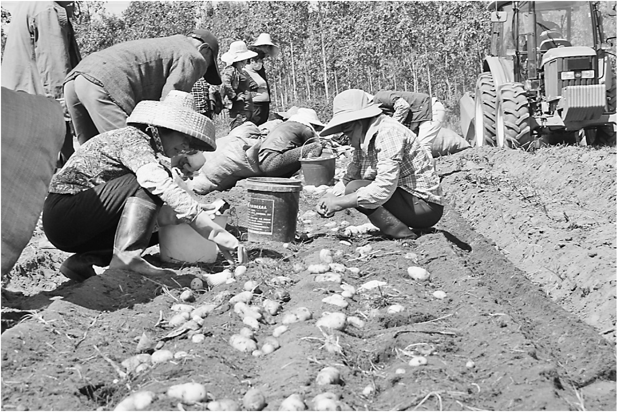
近日,望奎县龙薯农业生产合作社联合社在广东省湛江市遂溪县草潭镇铁仔村红土地上种植的500亩“黄麻子”土豆喜获丰收。