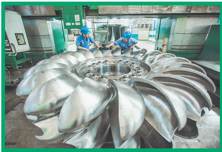
电力行业境外新签约项目前50位企业排名中,哈电国际名列第7位,成为了中国企业“走出去”的领跑者。

2016年5月7日,哈电集团哈尔滨电气国际工程有限责任公司(简称哈电国际)在蒙古国承建的首个总承包项目——蒙古额尔登特铜矿热电厂4x12MW汽轮发电机组扩建项目顺利开工,这是中蒙两国“一带一路”战略对接标志性项目,也是哈电国际坚持“走出去、走进去、走上去”的企业发展战略的新突破。 今年以来,哈电国际持续发力国际市场,继续成功签订迪拜哈翔4x600MW清洁能源电厂项目,又在巴基斯坦签订了西迪森350MW超临界燃煤电站项目总承包合同。此外,售后服务业绩持续攀升,实现合同金额约9300万元人民币。今年1-4月份,哈电国际实现正式合同签约额176.55亿元人民币,完成全年计划的146%,市场开发业绩再次刷新公司历史最高纪录。 喜人的数据延续着去年以来的辉煌:2015年,哈电国际正式合同签约额完成120.5亿元,这是自2008年订货额突破100亿元后,该公司实现的第8个连续递增年。在中国机电进出口商会统计的2015年中国