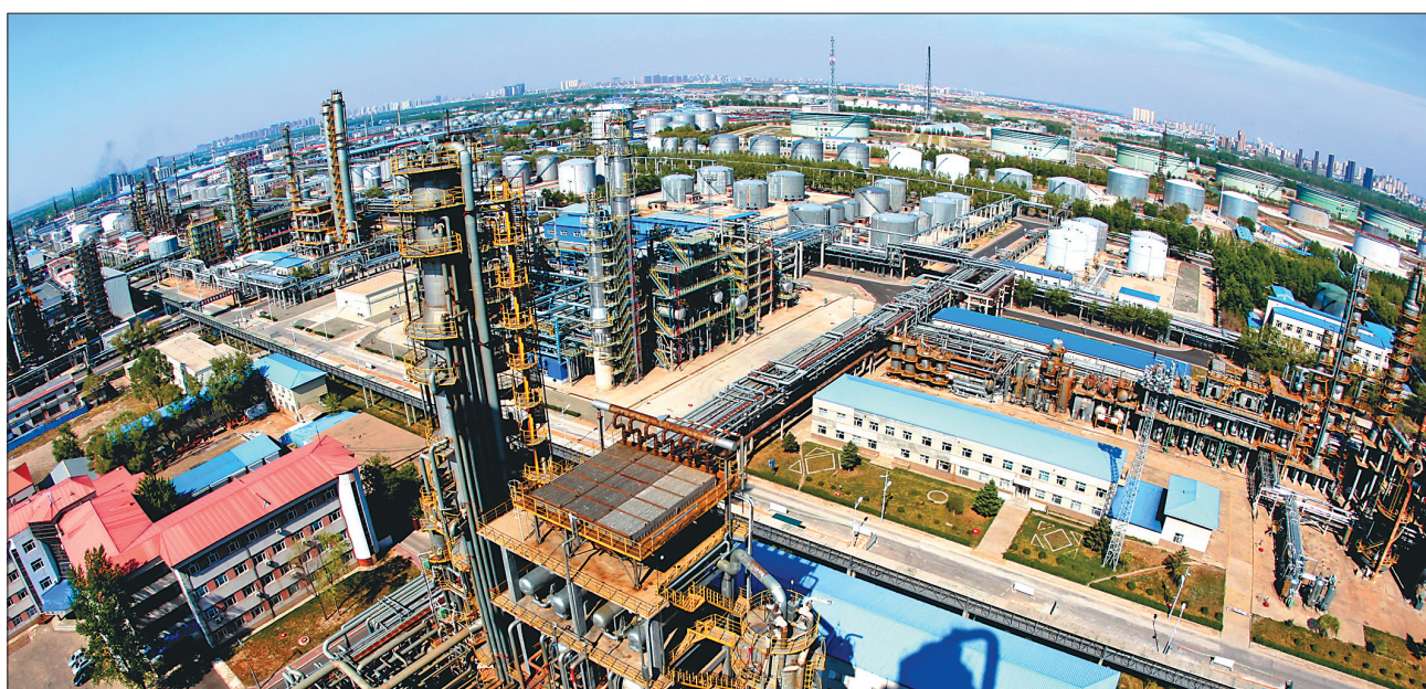
大庆炼化公司全景。