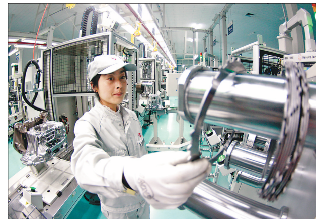
东安汽发以创新开拓市场。