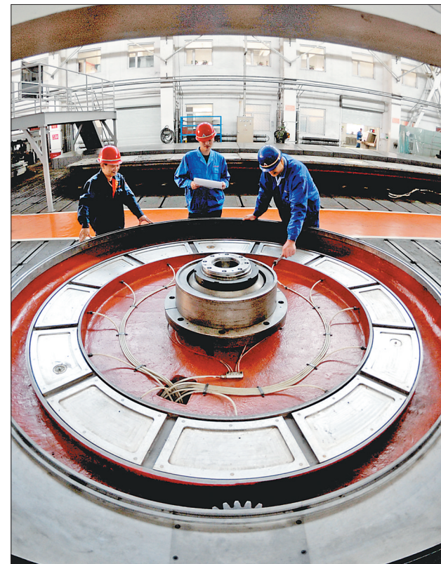
齐二机床加快技术改造和产业转型,已成为国内机床行业品种最多、服务领域最广的装备制造企业。