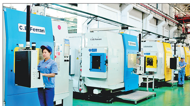
哈尔滨汽轮机厂有限责任公司一流的现代化数控机床。