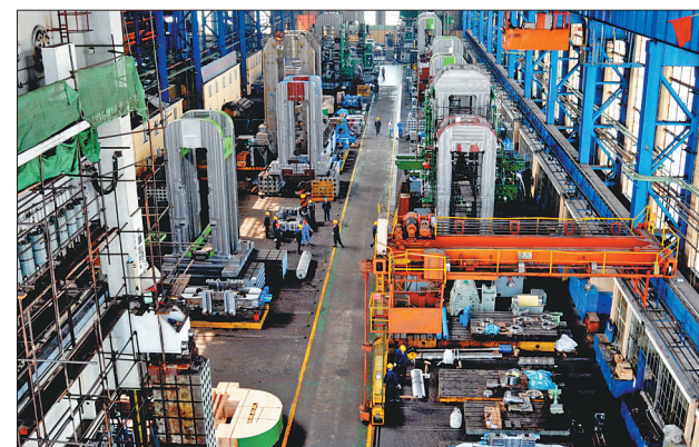
中国第一重型机械集团公司已形成能源装备、工业装备、环保装备、装备基础材料等四大产业板块。