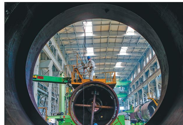
哈尔滨锅炉厂有限责任公司生产车间。