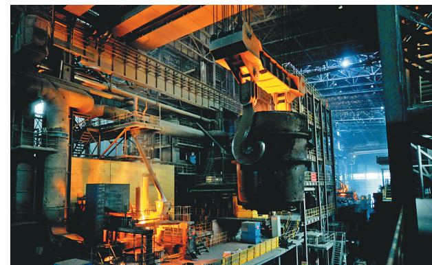
北满特钢是国内首家生产冷轧工作辊的企业,产品远销欧洲、中东等地。