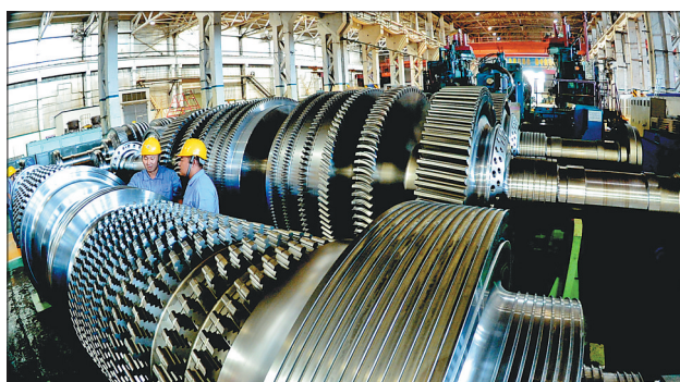
哈电集团的大型能源装备在国际市场捷报频传。