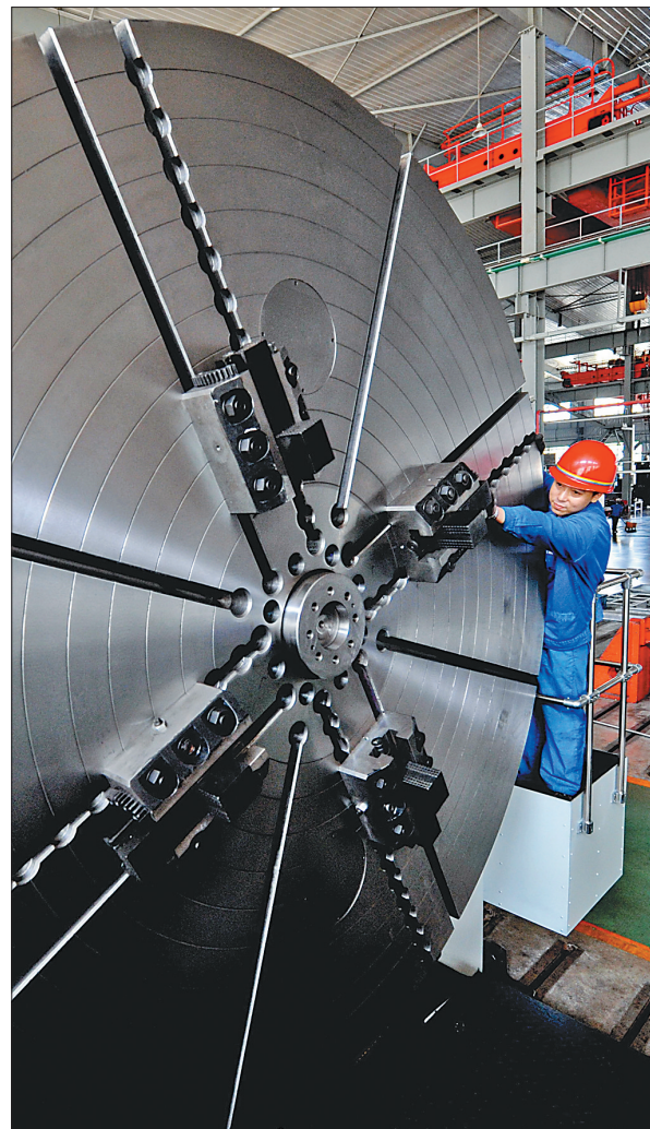
齐重数控装备股份有限公司生产的立、卧式重型机床在国内同行业处于领先水平。