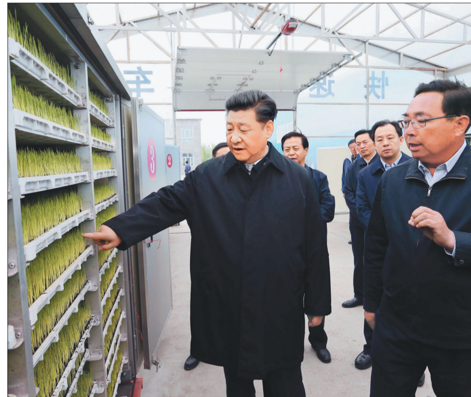
5月24日上午,习近平在抚远市双成水稻种植专业合作社了解箱式快速育秧技术流程。