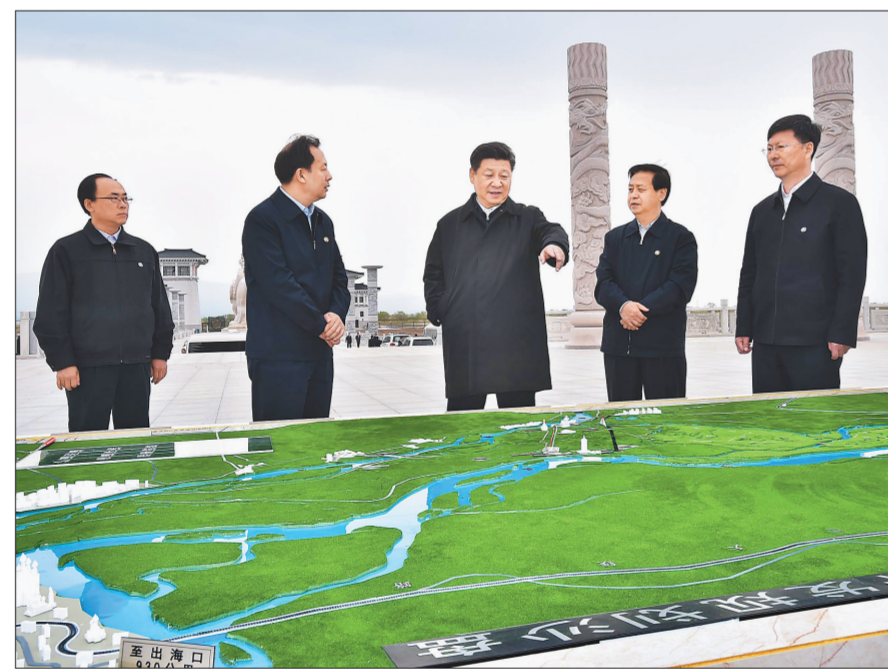
5月24日上午,习近平在我国东北端中俄边界的黑瞎子岛察看该岛保护利用规划。