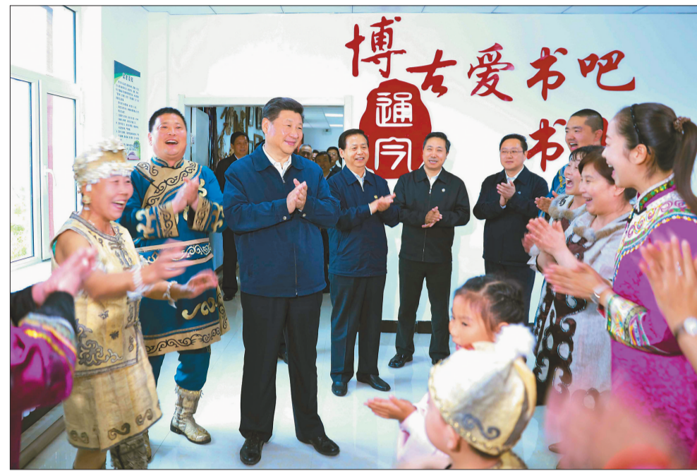
5月24日下午,习近平在佳木斯市同江市八岔赫哲族乡八岔村观看伊玛堪说唱教学。

五月的龙江大地,山清水秀,林茂草绿。5月23日至25日,中共中央总书记、国家主席、中央军委主席习近平在黑龙江省委副书记王宪魁、省长陆昊陪同下,来到伊春市、抚远市、佳木斯市、哈尔滨市等地,深入农村、企业、林场、科研单位,就贯彻落实“十三五”规划纲要、推动东北地区等老工业基地振兴发展进行考察调研。习近平强调,振兴东北地区等老工业基地是国家的重大战略。老工业基地要抢抓机遇、奋发有为,贯彻新发展理念,深化改革开放,优化发展环境,激发创新活力,扬长避短、扬长补短、扬长补短,闯出一条新形势下老工业基地振兴发展新路。