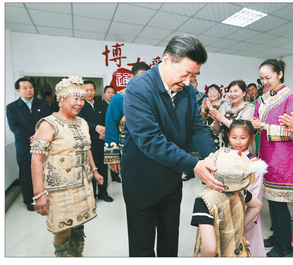
5月24日下午,习近平在佳木斯市同江市八岔赫哲族乡八岔村同正在进行伊玛堪说唱教学的村民们亲切交流。