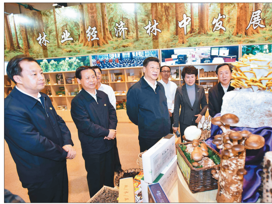
5月23日上午,习近平在伊春市生态经济开发区规划展示厅观看生态产品展示,了解林区全面停伐后产业接续发展情况。