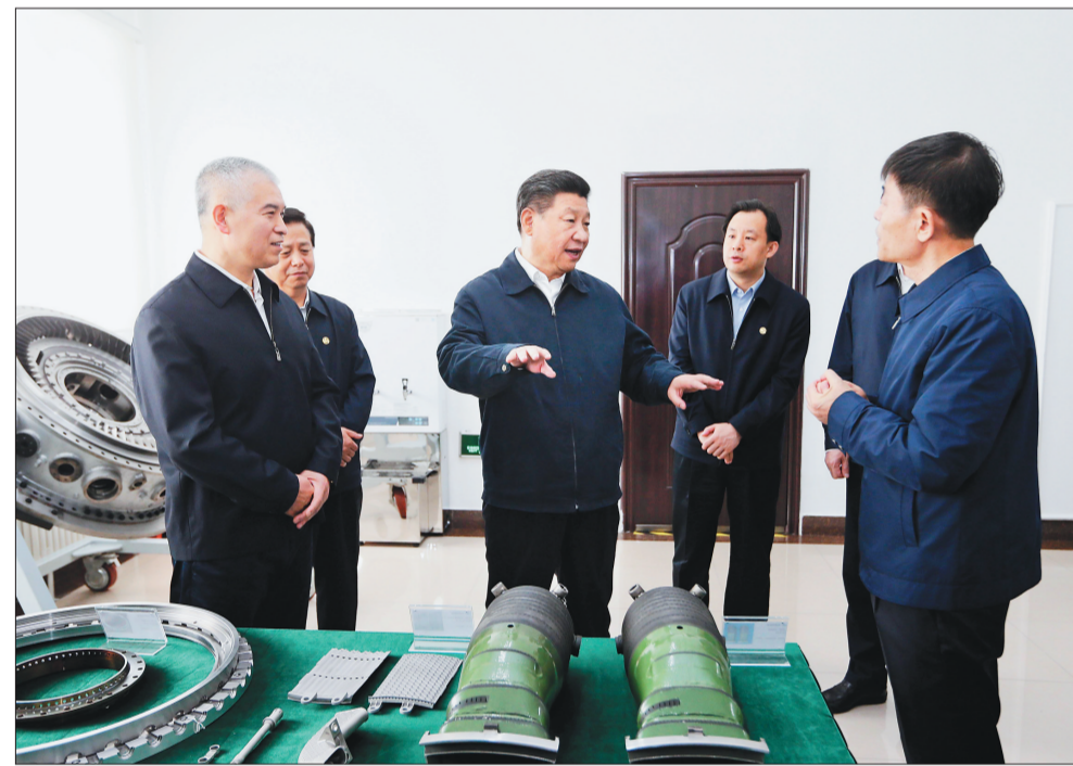
5月25日上午,习近平在中国船舶重工集团公司第七〇三研究所了解小型燃气轮机研发情况。