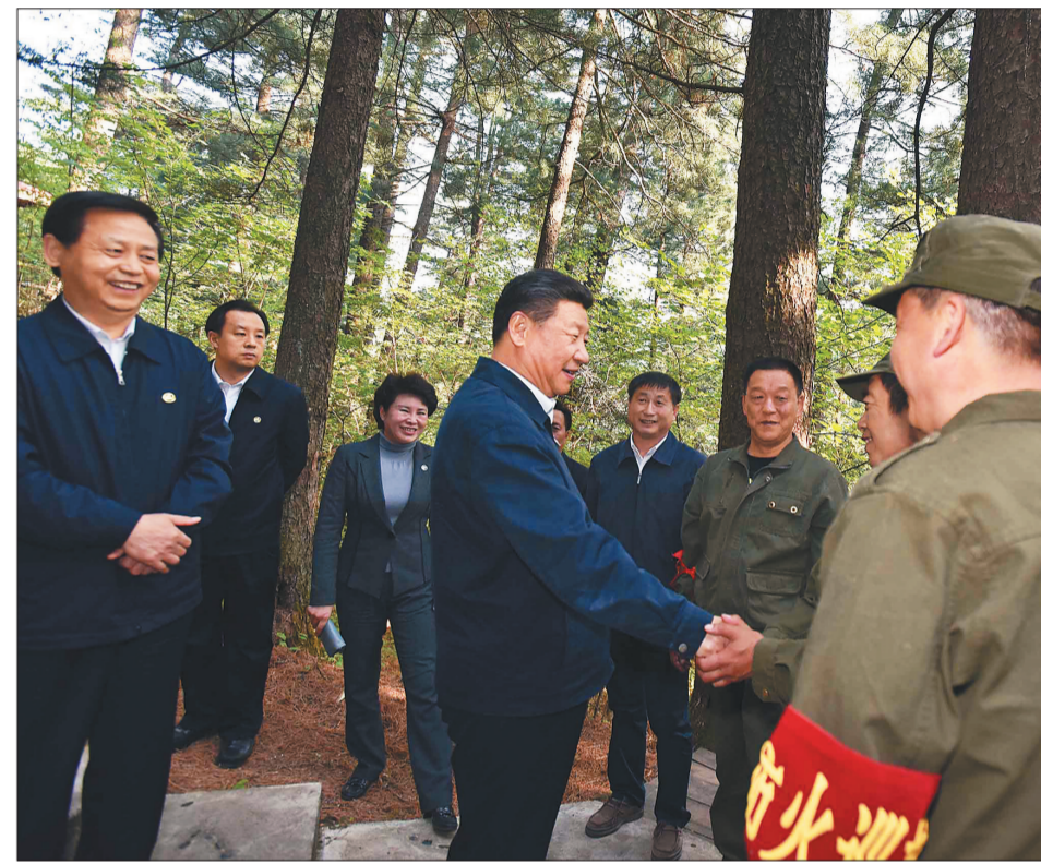
5月23日下午,习近平在上甘岭林业局乌苏水国家森林公园视察时,叮嘱林场工作人员一定要把森林资源保护好。