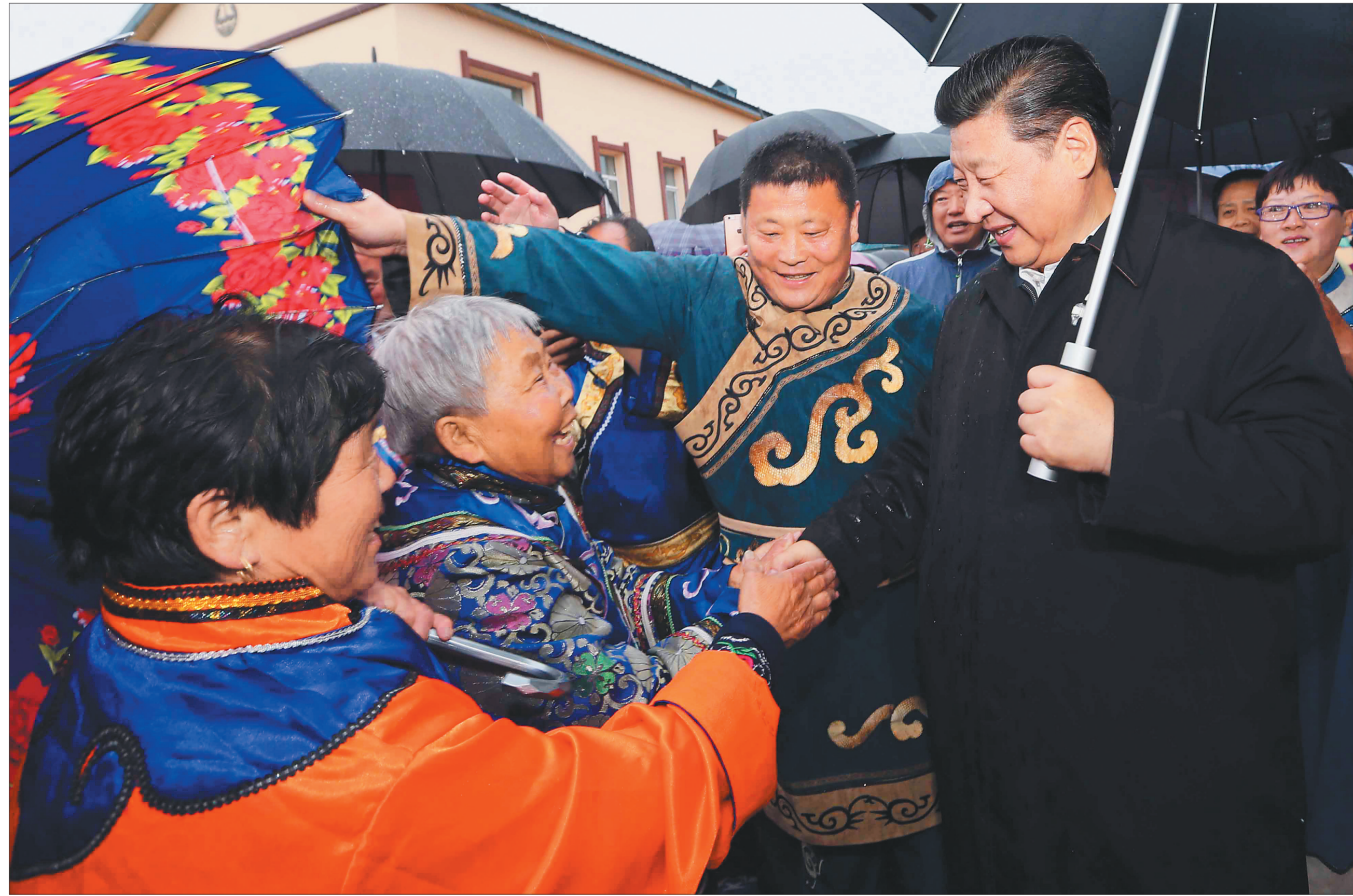
5月24日下午,习近平在佳木斯市同江市八岔赫哲族乡八岔村冒雨与村民们交谈。