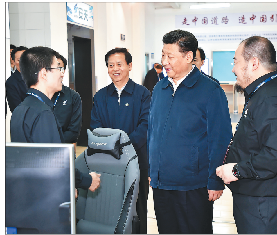
5月25日上午,习近平在哈尔滨安天科技股份有限公司听取科技人员介绍网络安全技术研发情况。