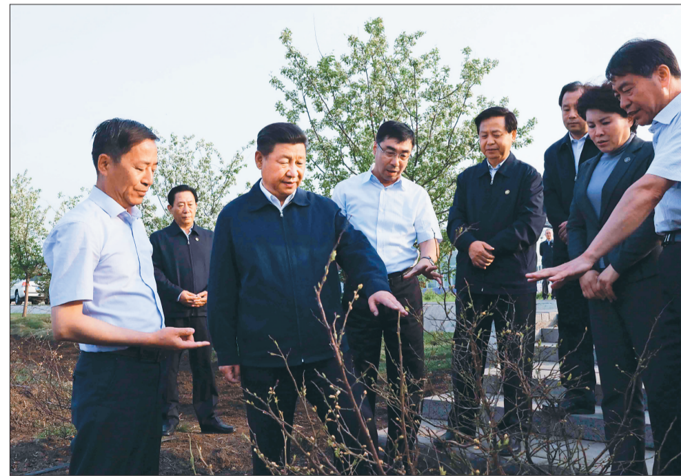
5月23日下午,习近平在伊春友好林业局万亩蓝莓产业园察看蓝莓种植情况。