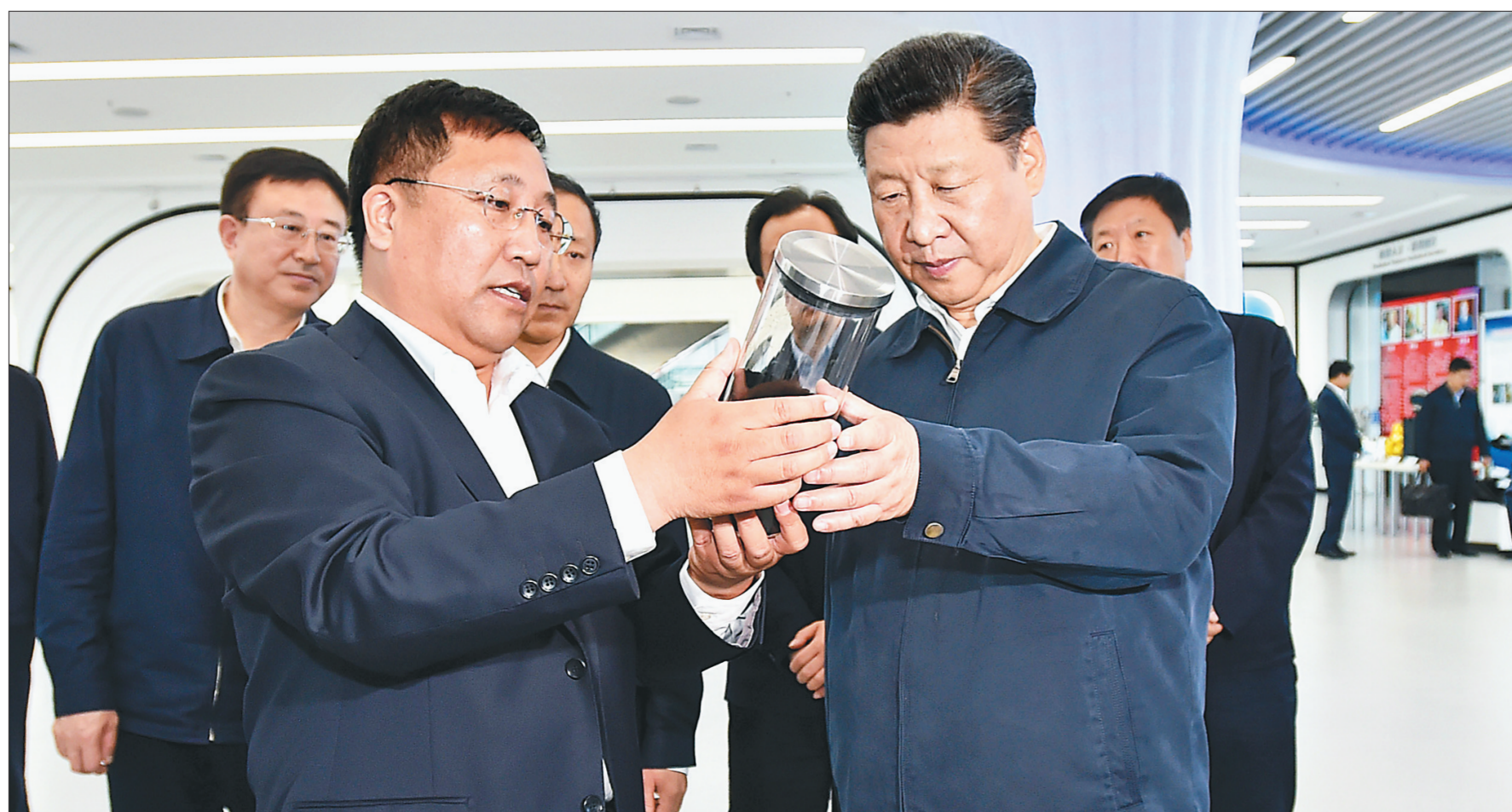
5月25日上午,习近平在哈尔滨科技创新创业大厦察看石墨烯高新技术成果展示。