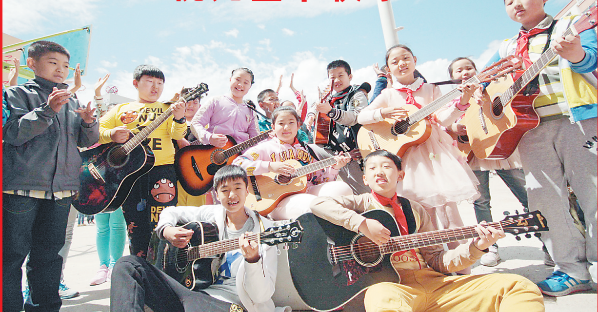
齐齐哈尔建华区全福小学举办了“六一欢乐周”系列活动，除了京韵、吉他、独轮车、魔方等10余个社团每天在校园里进行才艺展演外，还开展了“过福门、集福卡”评选百名福娃宝贝校外郊游、经典诵读、博物馆学生书画展等活动。 黄洋 本报记者 刘心杨摄