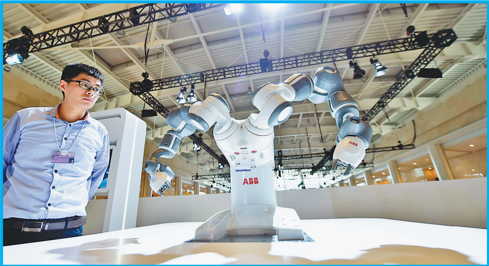
6月26日,工作人员在现场展示协作机器人。

年天津夏季达沃斯论坛上,新开辟的科技展区迎来众多参观者驻足体验。一项项“黑科技”让人们仿佛穿越现实,不时引来惊讶赞叹之声。下面就让记者带你走进会场,体验本次论坛上的科技创新热潮。