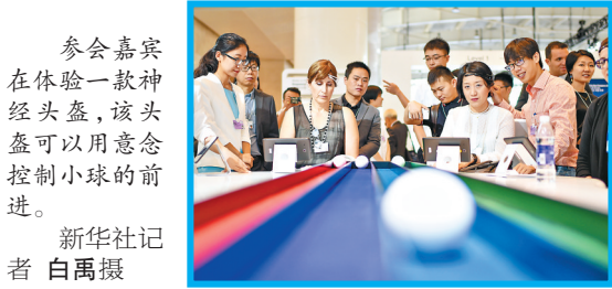
参会嘉宾在体验一款神经头盔,该头盔可以用意念控制小球的前进。