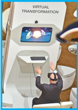
一名与会人员在使用运动控制器 Leap Motion 体验虚拟触控技术。

记者发现,无论是产品展示还是会场内的专家讨论,机器人、人工智能、生物技术都是最热的话题。正如世界经济论坛主席克劳斯·施瓦布在他的新书《第四次工业革命》中所述:“物理、数字与生物世界的融合是第四次工业革命的核心内容。”