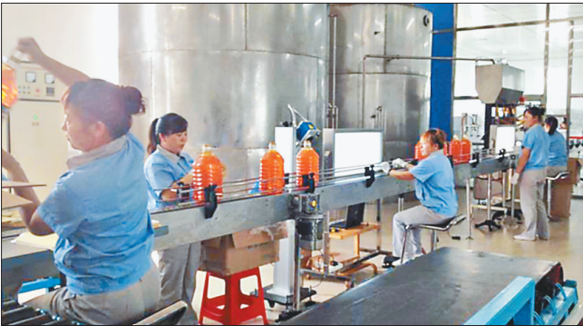
黑龙江冬雪生物科技有限公司大豆油灌装车间。