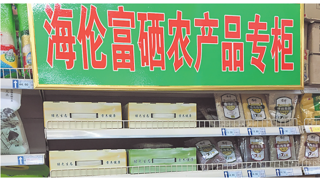
设在海伦市“兴隆大家庭”的专柜。