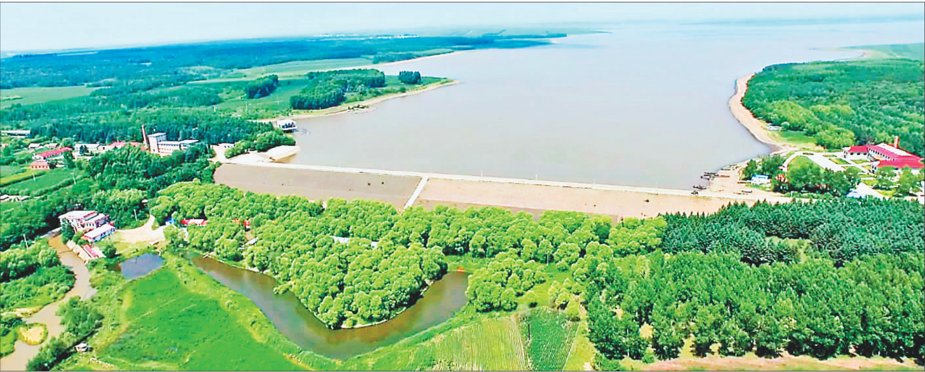
海伦市东方红水库。