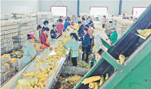
黑龙江原野食品有限公司鲜食粘玉米自动剥叶生产线。