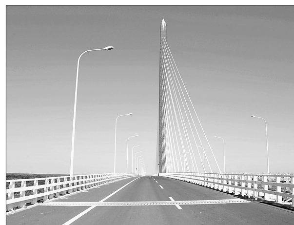
通往黑瞎子岛的乌苏大桥。