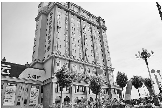
滨江公园施工现场。

抚远为了实现新发展新跨越,决心在全省经济振兴中走在各县市前列,充分发挥资源之长,靠产业支撑,提出了当前以及“十三五”期间加快发展以文化旅游、商贸物流、现代农业、新型工业、特色渔业为主导的现代产业体系,把特有的优势挖掘好、利用好、发挥好,特别是发挥华夏东极、“两国一岛”、淡水鱼都、赫哲故里等旅游品牌,下大力气发展边境游、民俗游、湿地游、界江游、避暑游、冰雪游以及健康养老等生活性服务业,带动经济发展。