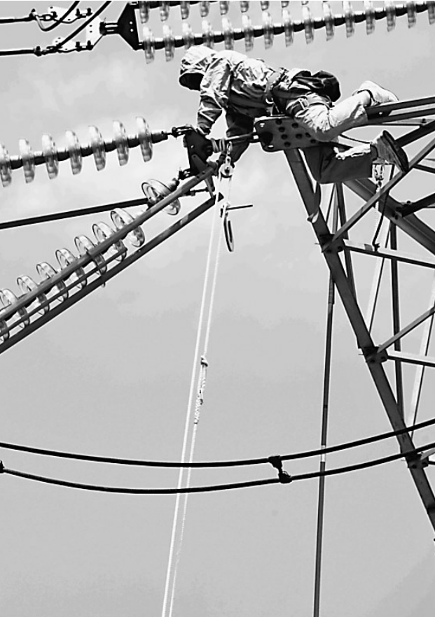
近日,国网双鸭山供电公司不断促进带电作业检修技术完善和提高,为地区经济发展保驾护航。

目前,双鸭山市的58种农产品入驻深圳绿膳谷体验馆,19种农产品在深农“海吉星”商城上架销售,深圳前海“农迈天下”电商在双鸭山建立了绿色食品直供基地。双鸭山市与深圳市旅游协会共同签署了《深双两地旅游客源市场互换协议》。与深圳商报达成合作意向,深圳商报开辟北大荒旅游专版,集中推出北大荒旅游资源和产品。