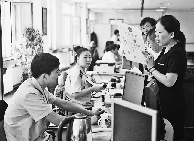
行政审批大厅内工作人员正耐心讲解办理流程。