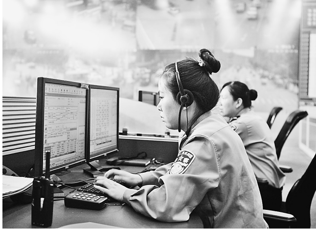
110指挥中心工作人员正在热情接听热线。