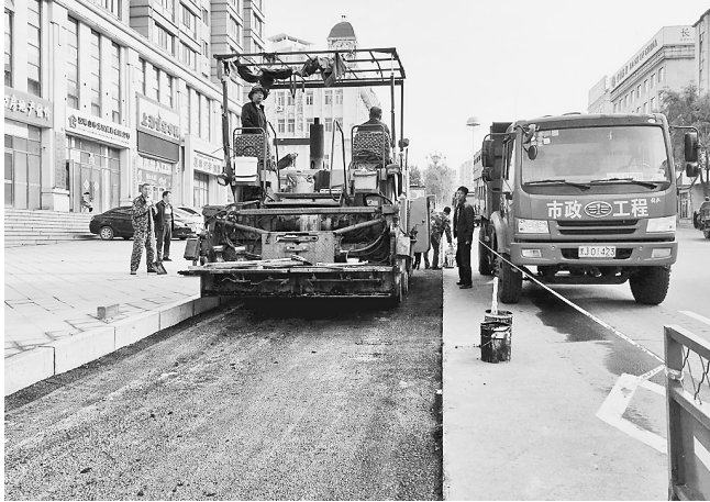
市政工作人员正在维修街道。