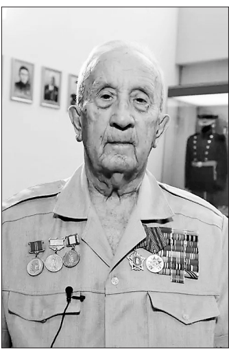
彼留科夫·弗拉基米尔·依里奇

日本投降后,李兆麟将军率百余名抗联干部进入以哈尔滨为中心的广大地区。李兆麟到哈尔滨后,立即建立了东北抗日联军驻哈尔滨办事处并任主任。与此同时,他还担任苏军哈尔滨卫戍司令部副司令。10月,成立了苏军管制时期的滨江省政府,由谢雨琴任省长(原伪滨江省民生厅长),李兆麟为副省长。