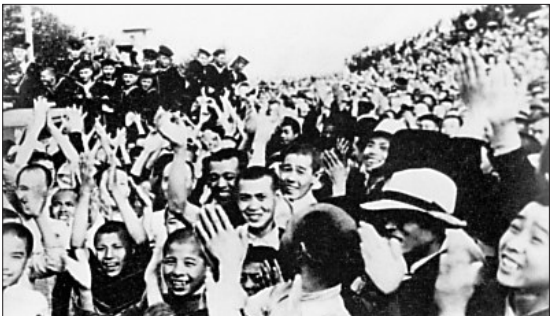
东北人民欢庆解放

彼留科夫·弗拉基米尔·依里奇说,8月18日,我们的部队打到了哈尔滨,首先夺取了哈尔滨机场,清除了跑道上的飞机残骸。我能感觉到,哈尔滨人最初见到我们时的态度是谨慎小心的,后来熟悉了,我们的关系变得亲切融洽。我在哈尔滨住了10