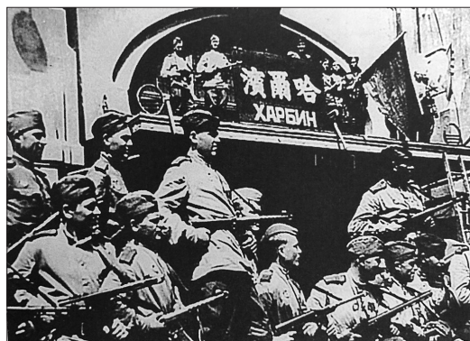
苏联红军进驻哈尔滨