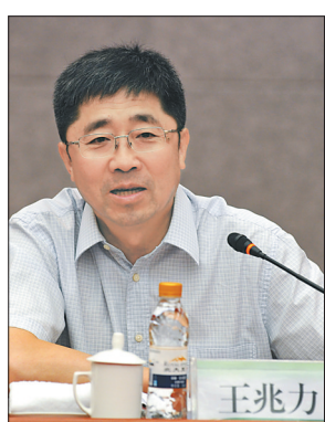
本报记者 郭俊峰 苏强摄

习近平总书记在考察调研时发表的重要讲话,对农垦改革发展目标做了全新定位,为农垦改革发展指明了方向,为推进农垦全面振兴提供了重要遵循和科学指南,是农垦破解难题、创新发展的金钥匙。贯彻落实讲话精神,既要全面准确把握讲话精神实质,落实讲话要求,又要学习掌握讲话蕴含的思想方法和工作方法。 一、突出问题导向,扬长避短、扬长补短、扬长补短,统筹抓好现代农业产业体系、生产体系、经营体系建设,更加突出问题