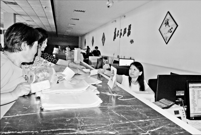
山河屯林业局行政大厅开设了14个窗口,涵盖了劳动保障、社会保险咨询服务、卫生、物业、供热、供水、供电收费等服务项目,诸多事关百姓的大事小情在此可一次解决,极大方便了林区群众。

下一步这个林业局还计划筹建加工厂,把林下产品加工进行市场销售,同时,通过互联网+的优势,把市场做大做强,走出龙江,走出穆棱,做出品牌做出效应。