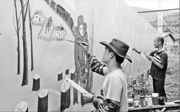
山河屯局聘请省美院专业人员,精心绘制中国雪谷民俗文化墙。