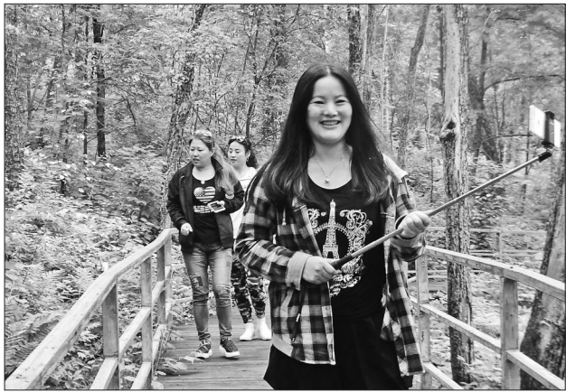
东方红局大力发展生态旅游经济,游客蜂拥而至。