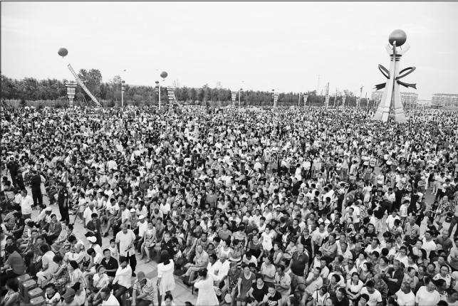
7月的通北林城景色迷人,欢声缭绕,文化广场气氛热烈,笑语飞扬。在这火热的盛夏时节,通北林区人民迎来满载火热之情的中国东方歌舞团“情系龙江美在森工”主题慰问演出的艺术家们,让林区人在家门口就能看到国家顶级文艺团体的精彩表演,6万平方米的文化广场挤满了观众,有5万多人观看了演出。

林区中院党组始终将党建工作作为促进法院整体工作科学发展进步的重要保障,与审判业务工作同部署、同检查、同落实、同总结。引导各级党组织和专兼职党务工作者创新党建工作理念、创新工作载体、创新工作措施,着力抓好集中学习、座谈讨论相结合,学习章程党规、学先进典型与学习身边的优秀共产党员相结合,学习上级文件精神与讲党课专题辅导相结合,“两学一做”与创先争优相结合。着力强化全体党员干警的政治意识、大局意识、核心意识和看齐意识,激励广大党员干警带头做学习提高的模范、争创佳绩的模范、服务群众的模范、遵纪守法的模范、弘扬正气的模范。不断加强党的思想、组织、作风和廉政建设,变党建工作被动开展为主动服务,营造了林区法院风清气正的良好氛围。