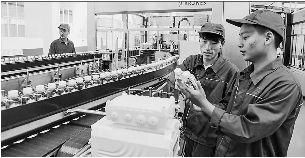
由北京汇源食品饮料有限公司投资3亿元建设的克东汇源食品饮料有限公司天然苏打水项目刚刚投产就接到大量订单。据悉,将分三期建设的此项目引进了德国克朗斯生产线,依托汇源集团固有品牌优势和成熟销售网络,可实现每小时81000瓶的高速运转,年生产能力达至300万吨。图为德国克朗斯生产线。

减负后的社区,精力投入在哪?“涉及盖章的事少了,但社区的工作量没有减少。”王淑霞说,社区为群众开展了特色化服务。该社区原先因精力不够开展不理想的社区儿童之家、文体活动中心,现在开展的活动越来越多,受到群众的好评。