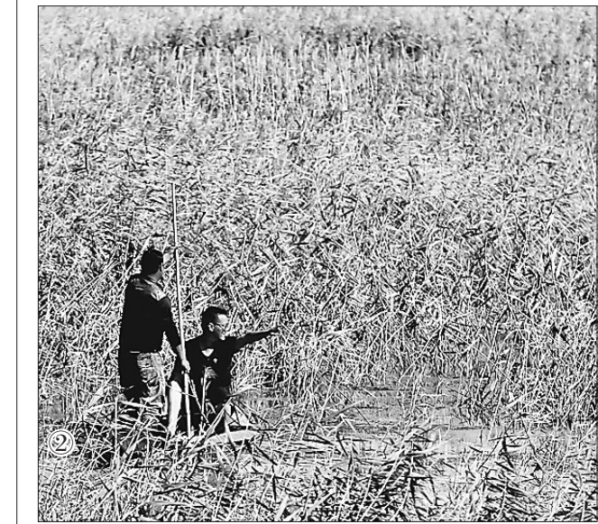
图①给鸟儿新编的窝。图②在水面上巡护。

近年来，哈拉海农场加大对湿地环境保护的力度，生态环境进一步改善，每年都有数万计的野生鸟类在保护区内停歇。农场湿地管理站的工作人员和近百名的农场志愿者积极参与湿地保护，他们加强保护区重点区域候鸟繁殖地、迁飞停歇地、迁飞通道、集群活动区的野外巡护力度和看守，采取分区负责制的办法，设点堵卡，打击区域违法捕鸟、投药毒鸟、持枪射鸟；重点清理违法设置的天网、粘网、定置网、毒饵、下套等危害候鸟等野生动物安全的隐患，逐一对非法设置的猎捕候鸟等野生动物装置进行清理和拆除。今年以来，他们深入保护区内部进行了20多次的全面细致执法检查 and 清理检查工作，共清除非法进入保护区人员200多人，扣留车辆二台。