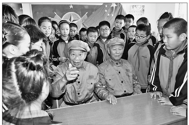
为纪念红军长征胜利80周年,让革命传统教育代代相传,伊春区南郡小学日前请来两位新中国成立前参加革命的老军人为学生们讲述当年革命斗争的艰苦历程,培养和增强学生热爱祖国的坚定信念。

一天下来,圆满完成了工作任务拖着疲惫身子回到学校的他们,有的冻感冒了,有的被蚊虫咬了一脸包,他们用火热的青春和辛勤的汗水扮靓了2016伊春国际森林马拉松赛。