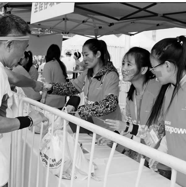
志愿者在为伊春国际森林马拉松赛提供服务。