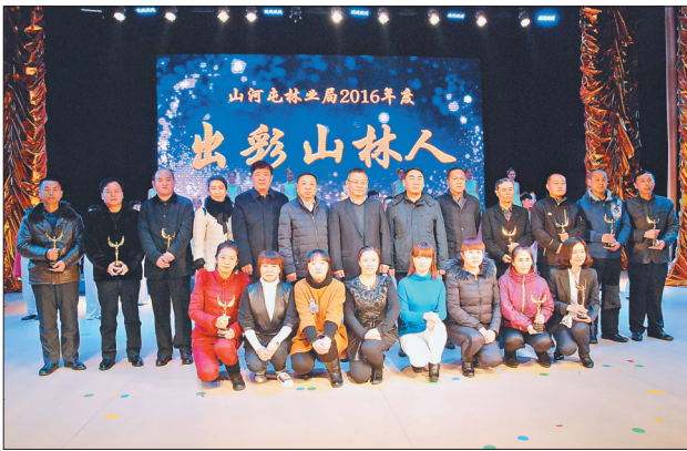
日前,山河屯林业局举行2016年“出彩山林人”颁奖典礼。受到表彰的十位(组)“出彩山林人”是这个局各个方面、各条战线的优秀代表,他们在平凡的岗位上做出了不平凡的业绩。

“科技兴林”强企富民 林口局内的林木、植被、动物及环境综合效益得到有效发挥,不但增加了林区生产作业任务量,解决了富余职工的就业问题,而且通过森林抚育生产出的剩余物,为职工发展食用菌等多种经营产业提供了原材料,增加了职工收入。 试点实施以来,林口局共生产抚育经营剩余物1.9万立方米,加工锯末子38万袋,生产食用菌2400万袋,创造产值7200万元,职工获利达2400余万元。同时,11万亩改培的红松果林全部发包到了职工手中,每年企业获利500余万元,职工增收2000余万元。此外,实施森林可持续经营使林内的自然资源更加丰富,各项林下产业层出不穷,种植业、养殖业、采摘业、食用菌及北药等五大基地纷纷在各林场所安家落户。胜利的千山山葡萄园,红石的林峰、团结的白瓜、东升的林参、奋斗的林禽、刁翎的果菜等特色产业,如雨后春笋,竞相迸发。 到2016年末,林口局共建成特色产业基地19个,多种经营总产值达到了5.37亿元,实现了“生态好起来、林子长起来、环境美起来、企业兴起来、职工富起来”的发展目标。