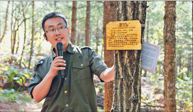
林口局工作人员介绍营林情况。

森林经营由量向质转变 1983年,2000年,是林口局发展史上两个重要的节点。林口局率先在全国实现了人工林保存面积100万亩和200万亩,在中华大地树起了一座不朽的绿色丰碑。 然而,在骄傲和兴奋之余,一个不容回避的世界性难题却摆在了人们的面前。 由于当年为了保证人工造林成活率和保存率,林口人始终采取大密度的栽植方式(3300——4400株/公顷),随着林木的逐年生长,林间拥挤,光照不足,通风不畅,枯死、风倒风折现象屡有发生。更严重的,是由于人工纯林结构和树种单一,抵御自然灾害能力差,病虫害发生率高居高不下,导致出现林木生长缓慢、林分质量低下、森林多种功能丧失等许多弊端。 2001年,林口局借鉴德国人工林近自然林业理论和新林业理论,创造性提出了“探索现代林业发展方向,全面实施森林经营,尽早尽快恢复和建立稳定的森林生态体系”的经营方针,大胆实施了“200万亩森林资源结构优化示范工程”,开展了人工落叶林、人工红松林、天然次生林,经济林结构优化改培实践。对人工纯林进行了定株抚育、修枝整形,透光抚育等措施。 从此,林口局开启了森林经营由量向质转变,朝着建设林分组成科学、林分结构优化、异龄复层针阔混交林的目标努力。 2008年9月,国家林业局在经过调研和论证后,确定在林口局实施“以60万亩人工红松林为培育目标”的优质高效森林经营示范项目。