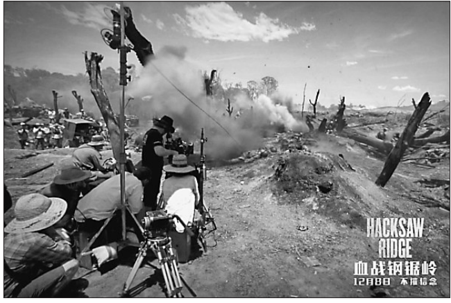
《血战钢锯岭》拍摄工作照