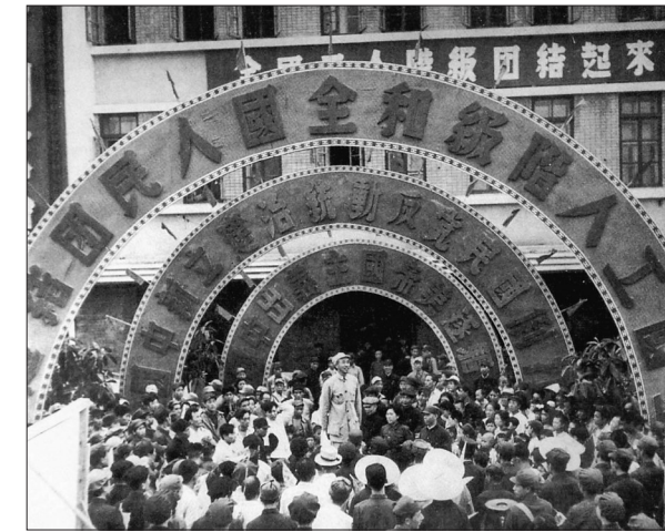
出席第六次全国劳动大会的各地代表在哈尔滨火车站

代表最多的用两个多月时间到达哈尔滨,而国统区上海的一部分代表辗转走了3个月时间,香港的代表和另一批上海代表,则化装成“阔佬”和商人模样,绕道朝鲜、大连到达哈尔滨。