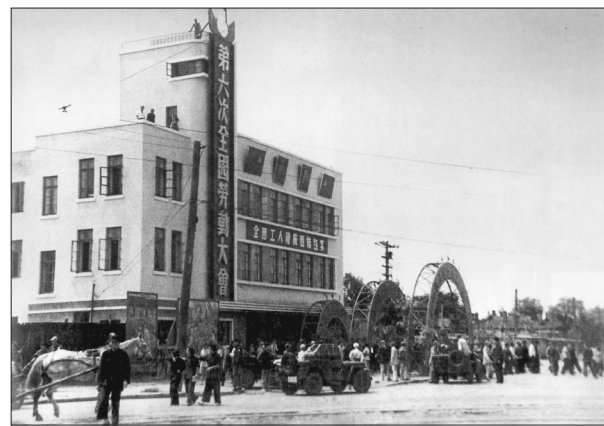
第六次全国劳动大会会址(今儿童电影院)

开幕式上,不仅有高水平的滑雪队表演,还有韩国国家示范队员现场做了精彩的示范滑行表演。比赛形式不同于以往大众滑雪比赛的“绕杆过门”方式,不设门旗,不拼速度,更加侧重测评技术动作作为比赛标准,以双板技术作为竞赛项目,按男女组别,分别以大小回转赛两项总成绩决定最终名次,并由来自日本前国家队教练安食英治、韩国滑雪指导员联盟的专家和国内有关专家组成的裁判组,根据选手完成质量现场评分,即时公布。该形式丰富了大众滑雪的比赛项目,填补了我省此类项目的空白。