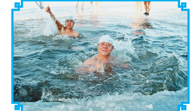
冬泳冬捕尽显神奇魅力

俄罗斯风情与冰雪相得益彰 领略最美最浓郁的俄罗斯风情,经典的建筑在白雪的掩映下更加浪漫迷人,冰雪覆盖着的河面上有一处都市雪乡景观,这里的雪屋、雪