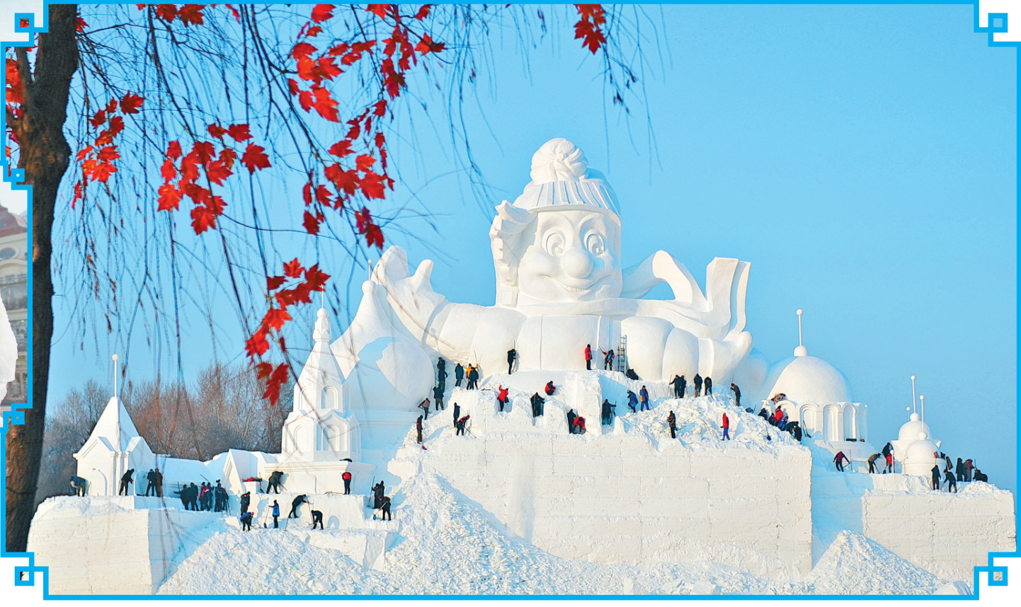
太阳岛打造冰雪童话世界。

龙江冬日风光如画,处处美景醉游人。12月20日,全民冰雪活动日在全省各地同步开启,冰雕雪塑展、徒步赛、冬钓、冬泳赛……各式各样、丰富多彩的活动在各地火热展开。 在哈尔滨,冰雪即是最为醒目的标签,满城冰雕雪塑将冰城装扮得分外美丽。来自“一冰一雪”两大诱人亮点呈现的炫彩美景让世人叹为观止;冰雪打造的冬日童话王国又将八方游客“灌醉”,让他们对冰城之“美”从此刻骨铭心。 沿全部由面包石铺就的中央大街走一走,来一场冬日里与冰雪的浪漫邂逅。霓虹初上,中央大街把它最妖娆妩媚的一面向世人呈现,五彩灯光晕染着冰雕雪塑,中国红的大灯笼点缀着洋房子,徜徉在中央大街,有那么一瞬,记者仿佛置身于欧洲某条时尚大街。冬日里,白雪皑皑下的伏尔加庄园深沉而内敛,30多座经典俄式建筑,在白雪下、寒风中静立,多了几分肃穆、几许神秘。置身其中,犹如来到童话世界的古老城堡,开启一段探知之旅。 冰雪大世界、冰灯游园会……在哈尔滨,像这样的冰雪景区还有很多。美景天成入画来,大自然赋予哈尔滨的冰与雪是难得的资源。如今,冰城人以勤劳、智慧大力发展冰雪旅游,为海内外游客展示着越来越迷人的风采。哈尔滨之冬,冰清玉洁的童话世界,不可错过的梦幻之旅。