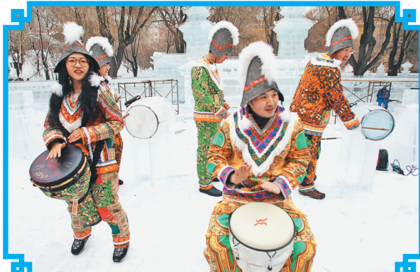
冰灯游园会手鼓表演