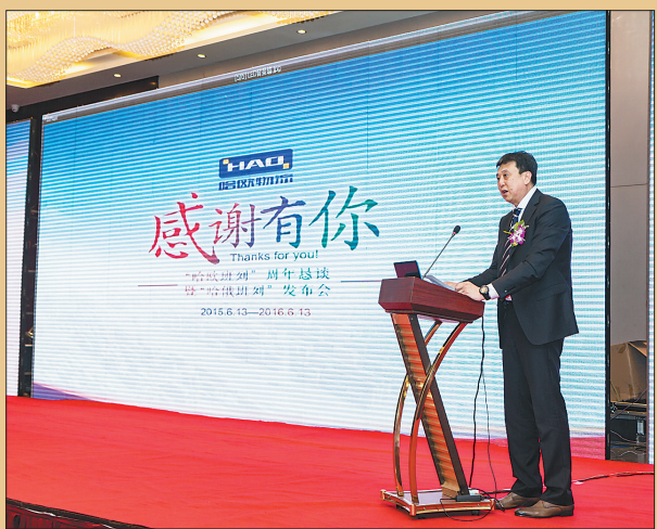
哈欧公司推介哈欧班列等产品。哈欧公司提供

货物,2017年计划开行哈尔滨至大连港、哈尔滨至锦州港循环班列,通过开展综合物流业务,提高企业的竞争力。三是研究提供差异化产品。2017年,哈欧班列将根据用户需求,适时推出品牌班列、直达班列、项目班列、循环班列、普货班列等;以哈尔滨铁路集装箱中心站作为集结点组织列发。针对满洲里口岸出口散箱数量占总量40%,将采取措施整合散箱资源。四是打破地域限制,合作开行班列。2017年计划开行华东至哈尔滨集装箱班列,与江浙地区的货代企业合作,开发俄罗斯货源。五是抓紧谋划建设网络体系。2017年在香坊区启动建设仓储、堆场等设施作为公司的自营场站,开展集货、仓储、流通加工、包装、配送等附加业务。在比利时泽鲁鲁日港建设集装箱场站,延伸境外功能;与俄铁合作建设集装箱场站,扩大回程集货能力。同时,构建全新管理体系,降低各环节成本;强化营销措施,叫响哈欧班列品牌,加快商业化运行进程。 大通道带动大物流,大物流带动大商贸,大商贸带动大产业。哈欧班列作为龙江丝路带的破题之举,必将推动我省外向型经济进一步发展。我们有理由相信,在全球经济一体化发展的大背景下,龙江一定能追风逐潮,扬帆远航。