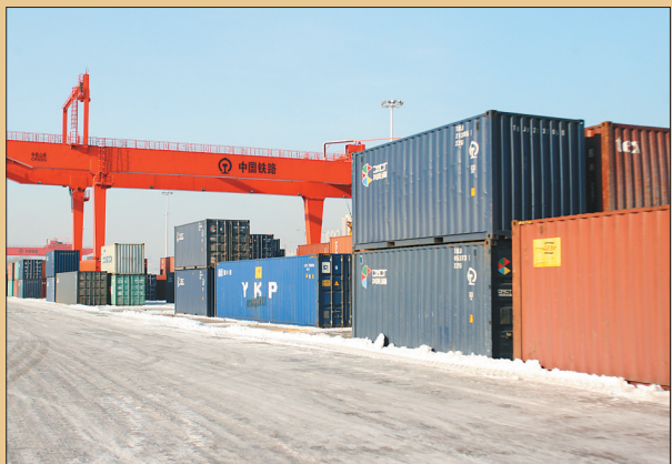
货站里整齐地摆放着准备启运的集装箱。