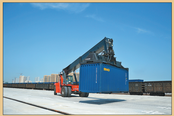
哈欧班列正在进行吊装作业。