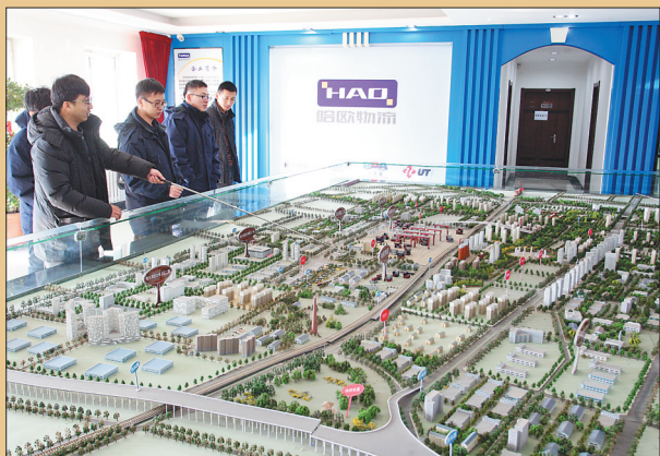
沙盘上展示着哈欧物流的远景规划。