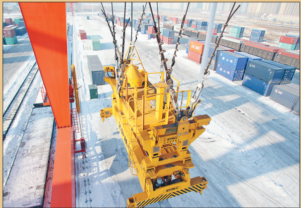
龙门吊每天不停地忙着装车、卸货。