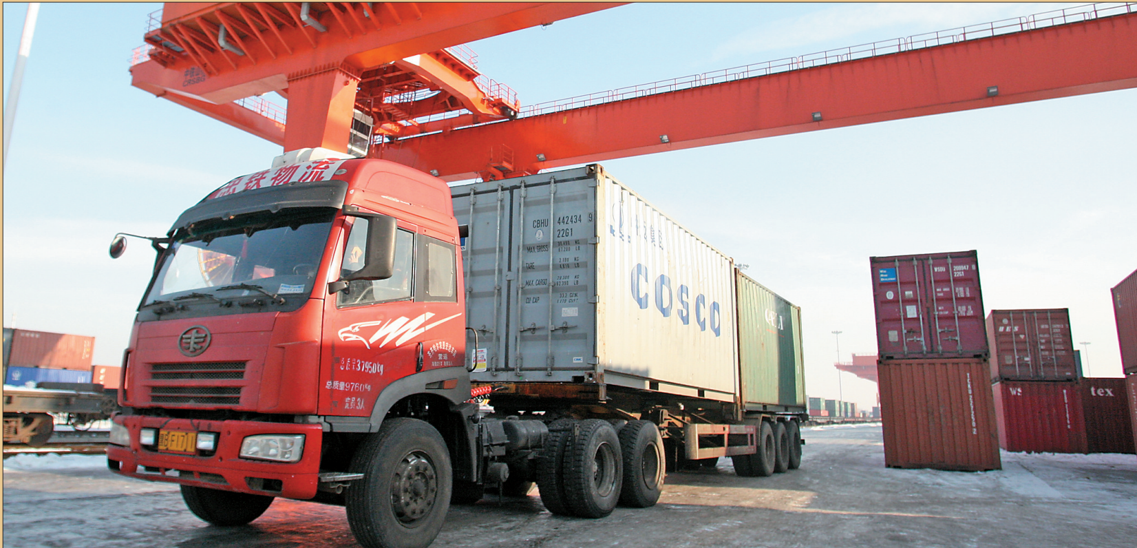
从欧洲发来的集装箱被装车运走。

穿越千山万水,再涌丝路商潮。12月17日,在哈尔滨集装箱中心站,由42个集装箱组成的哈欧班列,再次如约出发。凭借着“距离最近、速度最快、成本最低”的优势,哈欧班列将飞机零件、汽车配件、变频器、日用品等货物,快捷、安全地送抵万里之遥的俄罗斯和德国。 2015年,当“一带一路”战略构想浓墨重彩地铺向世界经济发展画卷时,地处祖国边陲的黑龙江不失时机地确立起自己的发展路径——融入其中,共图繁荣。2015年6月13日,作为龙江陆海丝绸之路经济带龙头引擎,首班哈欧班列带着发展的跳动律音,升腾起龙江的经济热度。2016年2月,哈尔滨至俄罗斯的国际班列开通。如今,哈欧国际物流让龙江离世界的脚步越来越近,“龙江声音”也传播得更广更远。