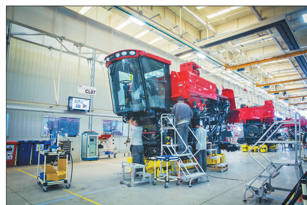
凯斯纽荷兰生产车间。

■加快保障性安居工程建设,已启动连片棚户区改造收尾,秀水名苑三期回迁房项目实现竣工入住。建设国家级防震减灾避难场所1处,创建市级减灾、防灾示范社区1个。以创新物业管理体制为重点,开展老旧小区综合整治,改善城镇中低收入家庭居住环境。