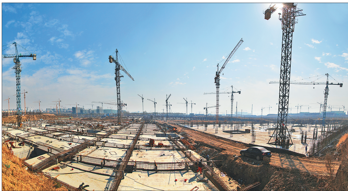
建设中的哈南会展中心。

五年来,哈南牢牢把握“促改革”目标,建机制、强服务,改革创新不断深化。努力优化发展环境,在“一表制”、“一图制”基础上,试行企业“一窗制”办理流程,投资服务中心