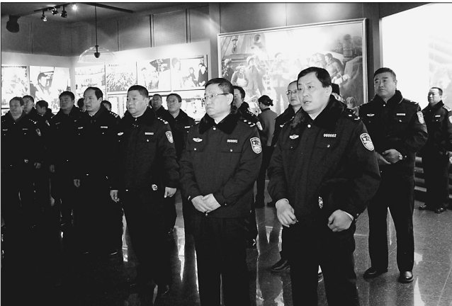
大庆公安人在铁人王进喜纪念馆参观现场。

本报讯(杨乃波 记者李飞)12月27日,大庆市公安局党委班子带领各分局、市局各部门负责人参观铁人王进喜纪念馆,重温大庆油田会战的历史,感受铁人王进喜的光辉事迹和闪光精神,提振公安士气,以更高标准开展公安工作。