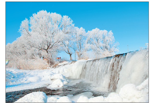
南、北饮泉。