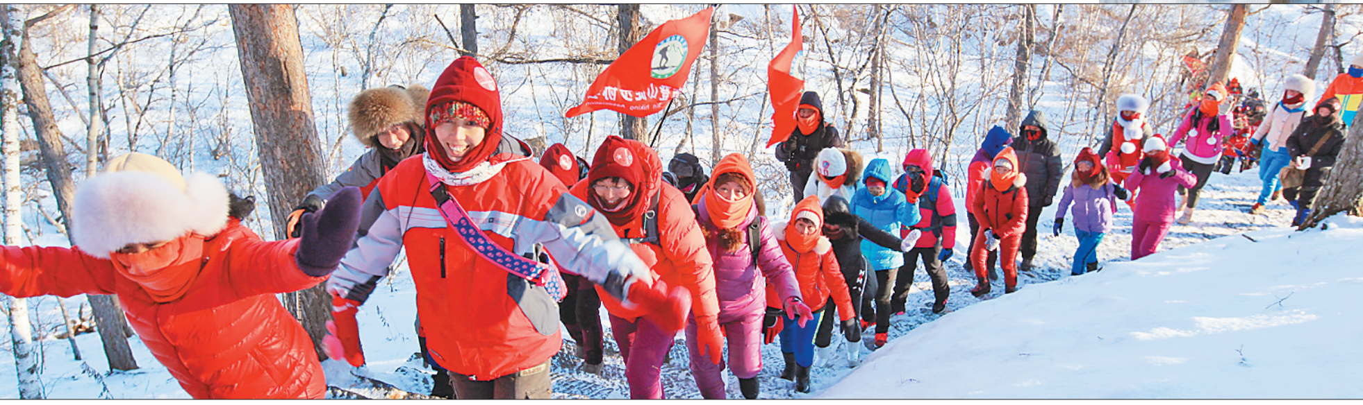
中国五大连池徒步大会。