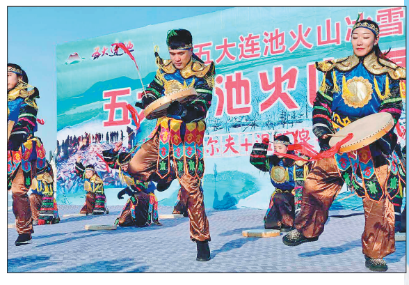
冬捕活动祭湖仪式。