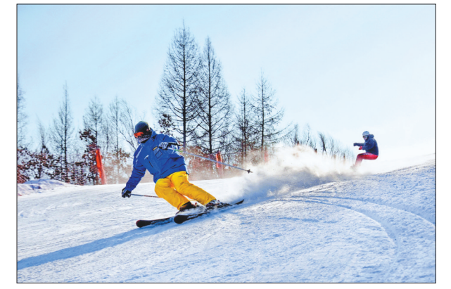
滑雪竞技。