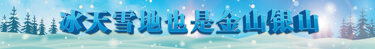
冰天雪地也是金山银山

本报6日讯(记者李健)6日上午,作为哈尔滨国际冰雪节系列活动之一的中国·哈尔滨第33届国际冰雪集体婚礼,在哈广电园冰雪欢乐谷举行。哈尔滨国际冰雪集体婚礼是中国首个以冰雪为载体的婚礼大典活动。据了解,本届国际冰雪集体婚礼由共青团哈尔滨市委员会联合市委宣传部、市旅游局等8家单位共同主办,哈尔滨青年宫承办。来自俄罗斯、中国的18对新婚和纪念婚朋友参加了本届冰雪集体婚礼。图为国际冰雪集体婚礼现场。