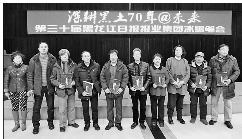
31届冰雪笔会,我们见证了很多参会的艺术家从初出茅庐到名满天下的闪亮历程。

这31届冰雪笔会,是黑龙江日报用三十七年时间绘就的文化蓝图,搭出的艺术舞台,在推动龙江文化大发展大繁荣的进程中,做出了不可磨灭的贡献,用艺术的点金之笔,将黑龙江的冰天雪地,点化成金山银山,点化成黑龙江人的物质财富与精神财富。一届届冰雪笔会,就像是冰天雪地中,跃动着的文化火焰,让龙江人追寻文化艺术的前行之路,温暖而明亮。