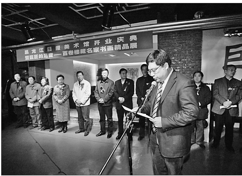
书画展览一场接一场,黑龙江日报美术馆成为国内外书画家及作品交流与展示的平台。

3 时代,就像一列呼啸前行的列车,在岁月光明的隧道中风驰电掣般驶过,一路,都是日新月异的风光,一路,都是翻天覆地的变化。而黑龙江日报冰雪笔会,也在这时代的快车道上进入加速度时间。在2004年之后的这十多年里,冰雪笔会更是频现大手笔、大动作、大气魄,让冰雪笔会不断提档升级、转型扩张,完成了其品牌建设、阵地建设、队伍建设、矩阵建设的一系列工程,彰显了一个主流媒体在黑龙江文化事业上的责任与担当、雄心与梦想。