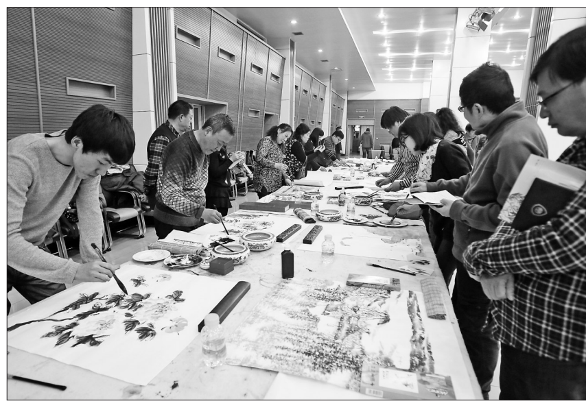
一届届冰雪笔会,就像是冰天雪地中,跃动着的文化火焰,让龙江人追寻文化艺术的前行之路,温暖而明亮。

此届冰雪笔会真正走向了市场,走向了市民生活,在哈尔滨国际会展中心举行的第23届冰雪笔会书画拍卖会圆满成功,150幅书画作品全部拍出。从此冰雪笔会不仅是文人墨客的专享,更成为全民大众的文化娱乐和新的消费方式,让文化艺术惠及龙江市民百姓,让书画的“堂前燕”,飞入寻常百姓家。2010年起,黑龙江日报报业集团更是受深圳文博会、大芬村、雅昌版画村的启发,决定采用产销对路以合乎百姓艺术需求的新策略,周密地组织并实施“专业画家作品进家庭文化工程”,先后动员了全国各地的100多位专业画家加盟到这项促进黑龙江省文化大发展的事业之中,并提出了旗帜鲜明的口号——“一起,百姓买得起!”一元拍卖,让艺术“俯首”大众做“长线”文化工程,在市民中引发热烈反响和追捧。在互联网时代,黑龙江日报报业集团着力于抢滩网络空间打造艺术阵地,让黑龙江日报以冰雪笔会为主打品牌的文化艺术产品,有了立体传播空间。