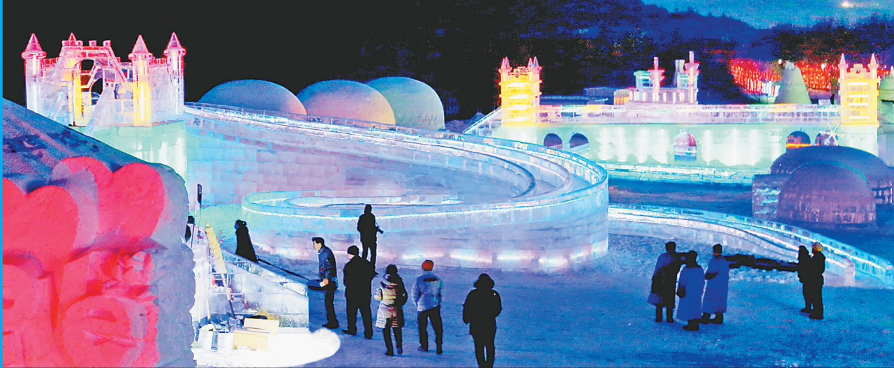
新年伊始,佳木斯市郊区建设的赫哲雪村开门纳客。冰雪浇筑的大型赫哲民俗雪雕、古老的赫哲文艺表演和热气腾腾的赫哲鱼宴,让游客在赏冰玩雪中将民俗、冰雪、体验三者有效地融合在一起。

本报(记者李天池)日前,2017城市清冰雪模式论坛暨机械装备展示会在哈尔滨国际会展中心举行。论坛上,沈阳、武汉、乌鲁木齐、哈尔滨市城市管理部门分别介绍清冰雪经验做法。