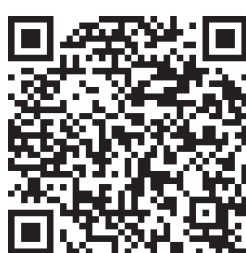
《政府工作报告》中的名词解释H5二维码