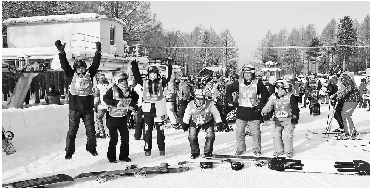
2月12日,黑龙江·铁力“日月峡杯”大众高山单双板滑雪赛开赛,来自哈尔滨、大庆、鹤岗、绥化、伊春等地的8支代表队120余名滑雪爱好者,在皑皑白雪间展开了一场时速对决。