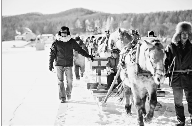
图为《爸爸去哪儿》剧组在桃山拍摄现场。

季旅游5条黄金线路之一的契机,结合全市冬季旅游重点推出“八个核心产品”的安排部署,坚持“以节促游、以节兴旅”,以“体验狩猎冰雪温泉,感受运动养生文化”为主题,精心策划了第二届伊春·桃山狩猎温泉冰雪文化旅游节,围绕狩猎体验游、温泉养生游等特色冬季旅游产品,推出“桃源湖冬捕、玉温泉冰装秀、兴安之巅峰穿越、狩猎文化体验、玉温泉康养”等系列活动,打造特色精品线路,发展品牌旅游。