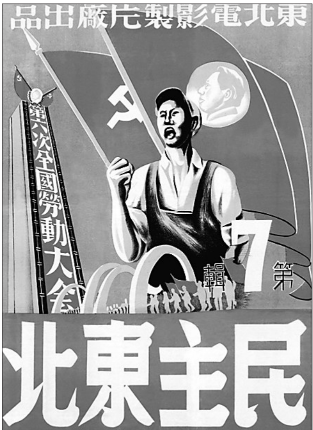
新中国第一部长纪录片《民主东北》第七辑电影海报。

在今天,“传统”二字,更多是为了标识这些期刊的悠久历史和纯文学定位,并不意味着保守刻板、不思进取。恰恰相反,重要文学期刊都在努力创新机制、想方设法拥抱新媒体,一方面吸引写作者,提升作品质量,一方面吸引读者,最大限度传递优秀作品的感染力。好容易回暖,谁都不想倒春寒。文学期刊还需抓住机遇,砥砺前行。 据《文艺报》报道