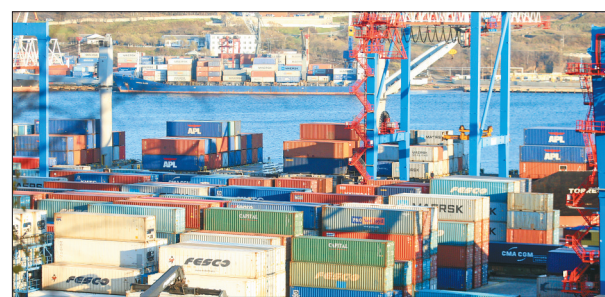
杨廷制图 图为符拉迪沃斯托克港口。

为踏访陆海联运大通道境外俄罗斯部分,一大早记者从绥芬河过海关。 绥芬河口岸站至俄罗斯格罗迭科沃口岸,两地相距仅26公里。记者了解到,目前格罗迭科沃口岸最大通过能力开行宽轨列车14对,现有高站台换装线3条,换轮设备1套,龙门吊换装线2条,汽车吊换装线4条,集装箱作业能力一批换装5辆,每日可换装二批共10辆。而绥芬河至符拉迪沃斯托克港口区间由俄联邦公路和西伯利亚铁路连接,西伯利亚铁路为双线电气化铁路,输送能力在5000-6000万吨。(下转第二版)