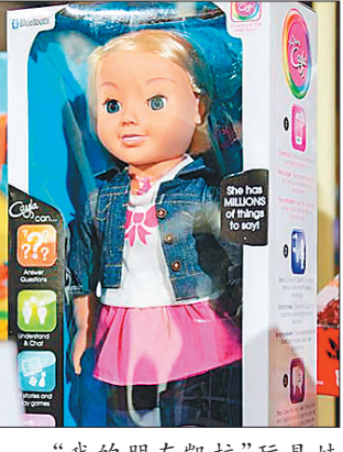
“我的朋友凯拉”玩具娃娃

新华网北京2月19日电(记者郑思远)德国互联网监管部门17日将一款能够上网并与人交流的智能玩具娃娃拉入黑名单,原因是这款玩具可能遭到有心之人利用,侵犯使用者隐私。