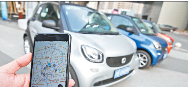
市民演示使用手机软件定位“共享汽车”。

主流车型是电动车,也有少部分是燃油车,如重庆投放的戴姆勒集团旗下的“即行car2go”等。从投入规模看,投入车辆多的城市有数千辆,少的则有几百辆,整个市场尚处于萌芽、培育阶段。