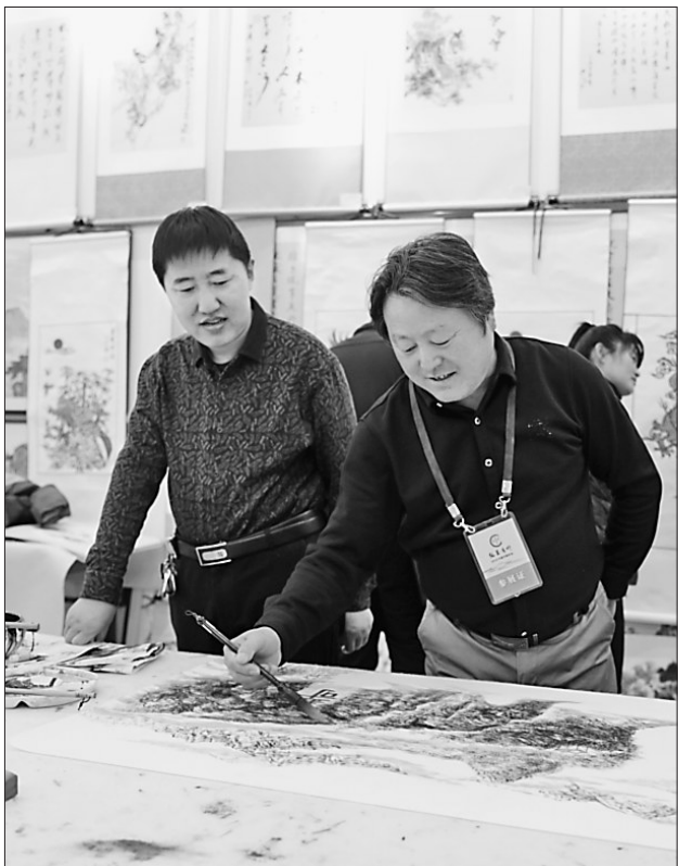
2月12日,“中国书法之乡”巴彦县举办的“书画艺术雅集”交流活动在全泰画廊拉开帷幕,全县众多书画家及书画爱好者齐聚一堂,妙绘丹青,展示了巴彦书画艺术的底蕴。 宋立国 王晓东 本报记者 白云峰摄

积极探索关爱“留守儿童”的新路子。依兰县为“留守儿童”开展了丰富多彩的活动,让他们在活动中得到教育,在活动中健康成长,由老师当“亲情爸爸”、“亲情妈妈”,在老师家中举办“亲情家庭”聚会,“留守儿童”与老师及老师的家人一起动手制作一顿丰盛的家宴,让他们在劳动中体验幸福;还开展了“亲情集体”活动,举行主题班会、团队活动,举办演讲比赛、读书比赛、文艺演出、球赛、游戏比赛、红色旅游等活动,让“留守儿童”感受到老师的可爱可亲,不再觉得孤单和寂寞。