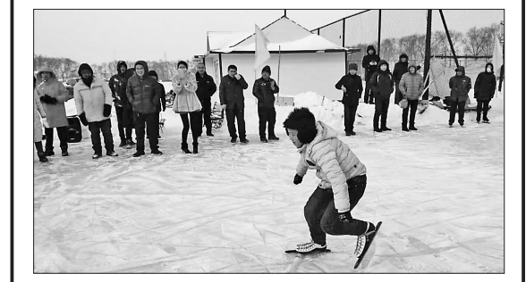
进入正月佳节以来,木兰县文体局、文化馆、博物馆、图书馆和体校联合举办了秧歌汇演、文物展、图书展、猜灯谜和速度滑冰比赛等系列活动,把鸡年的正月搅得火热。 木兰县系列文体活动有10支秧歌代表队800余人参加的汇演,有108名运动员参加的速度滑冰比赛,参加猜灯谜和观看文物展、图书展和非物质文化遗产宣传图板的群众达到上千人。 王雪菲 本报记者 白云峰摄